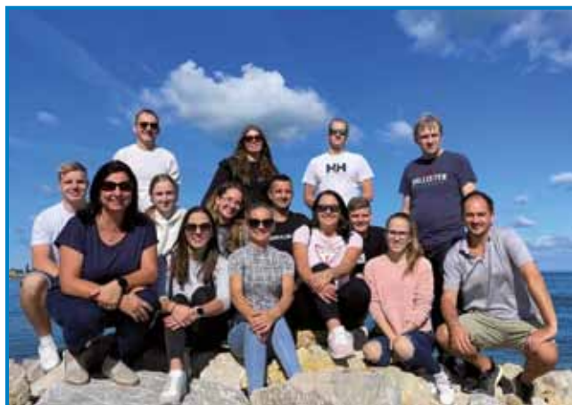
Še ena »gasilska« na obali v Kopru