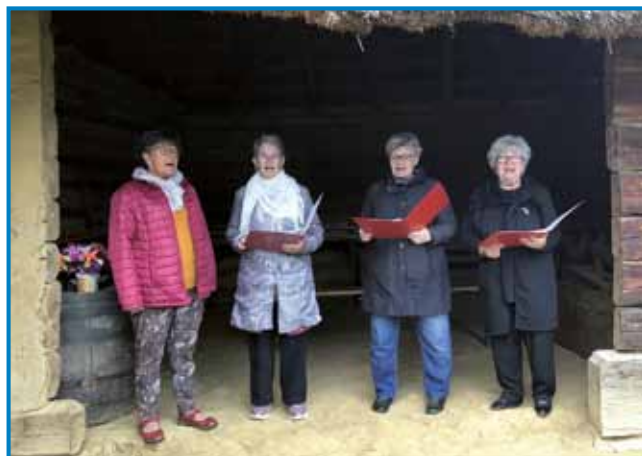
Pevski zbor madžarskoga družtva Baráti kör z Murske Sobote - ženske spejvajo vogrske in slovenske ljudske in umetne pesmi

Tau je bilau 15., jubilejno srečanje sombotelski Slovincov in soboški Madžarov. Zatok so