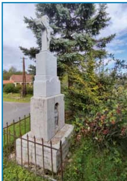
Petrajnin križ je postavila držina, ka se je gazda rejšo smrtne nevole

- Čidni so tej psauvdje, steri kaulak vašoga rama