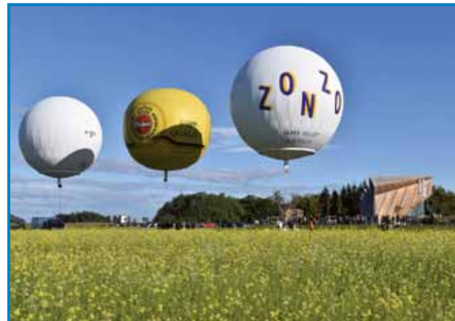
Trge plinski baloni so iz Prekmurja leteli vse do Kaposvára