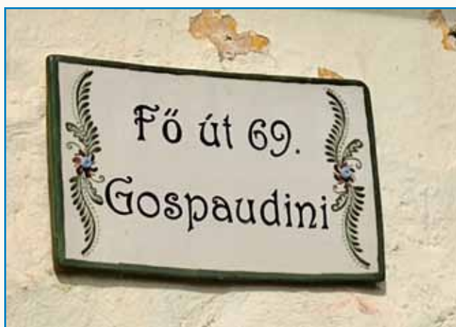
Vsi kaulak so že vöpomrli stran 8