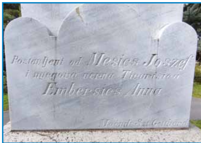
Gda so križ obnovili, so ga pistili obrnjenoga kraj od pauti

»Te Vogrin je ma, steri je moj saused, ranč ne vejm, tjelko psauv je vsevküp.