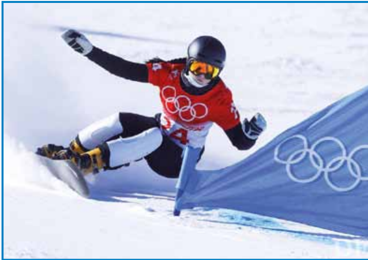
Gloria Kotnik je na olimpijski igraj v Pekingu osvojila bronasto medaljo

Skijarka na deski Gloria Kotnik je na letošnjih zimskih olimpijskih igrah v Pekingu napisala eno najlepših pravljic. Po tistem ka je na igre prišla skauzi šivankino vüjo,