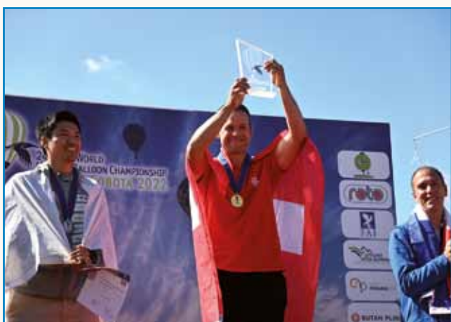
Prekmursko nebau je bilau pisano stran 3

»AJ PONOSNO LEKO POVEJMO, KA NAS JE DOSTA«