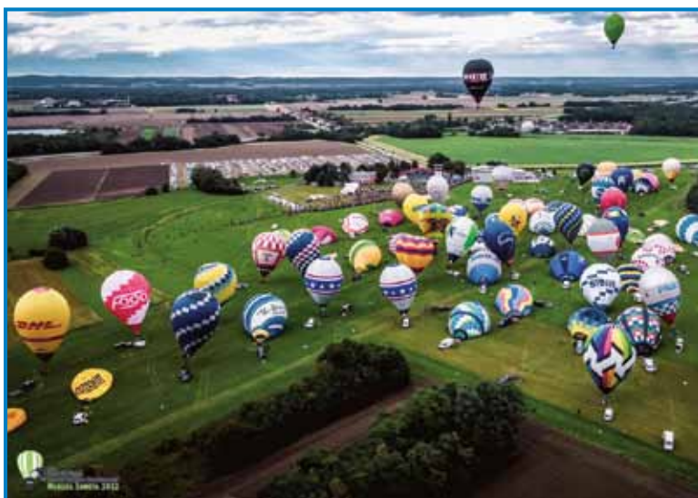
Baloni se zdigavlejo nad prekmursko ravnico

ga cilja. Na tekmovanji, stero je potekalo v skladi s standardnimi pravili FAI, je bila ena od klasičnih nalog tüdi lov na lisico. Tau pomeni, ka je biu eden balon lisica, drügi pa so