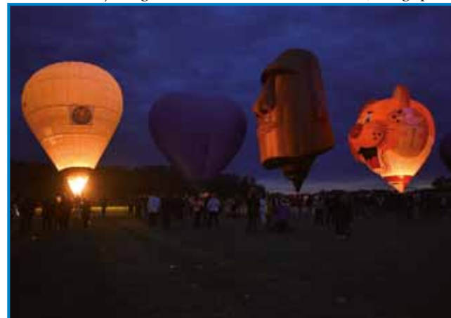
Night-Glow, nočno iluminacijo balonov na letališči, so pripravili dvakrat. Baloni vnoči delüvlejo kak čarobne lanterne

dosta različnih nalog. Že prvi den zrankoma, gda so mogli poleteti prauti letališči v Rakičani, in tau tak, ka je vsakši