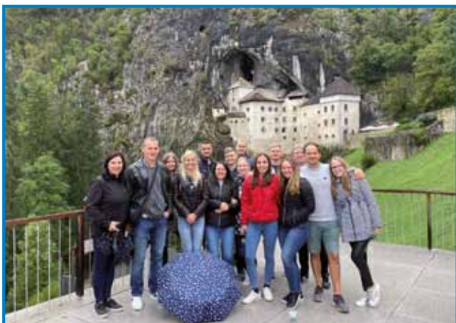
Člani sakalovske folklorne skupine pri Predjamskem gradu

V sredini septembra so člani Folklorne Skupine ZSM Sakalovci preživeli konec tedna na slovenski obali. Tradicijo, da vsako leto organiziramo izlet, smo obudili, saj smo načrte na žalost zaradi covidu v zadnjih dveh letih vedno prestavljali.