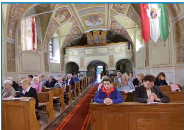
Če rejsan je bilau tisti četrtek trno slabo vrejmen, so verniki lepau vküpprišli

prej mora slejdnjo mazanje dati ednoma trno betežnoma