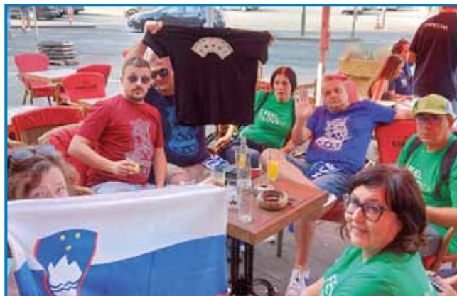
Slovenski in bosanski navijači v Kölni

malo več kak 144 metrov duga in malo več kak 86 metrov šurka. Tau je največša gotska cerkev v severom tali Evrope. Leko povejm, ka je bilau žmetno preoditi 533 stub, ali se je splačalo, tak ka je bilau tau rejsan eno velko doživetje, po sterom sam spila svojo najdrakšo pijačo na tom dopusti. Za 7,5 dcl glaž mineralne vode sam plačala skor 7 evrov. Prva kak sve se v ponejlek zrankoma odpelale prauti daumi, je v nedelo Slovenijo čakala ške tekma prauti Bosni in Hercegovini. Že v soboto sve se srečale s starim pajdašom Emirom, steri je prišo iz Sa-