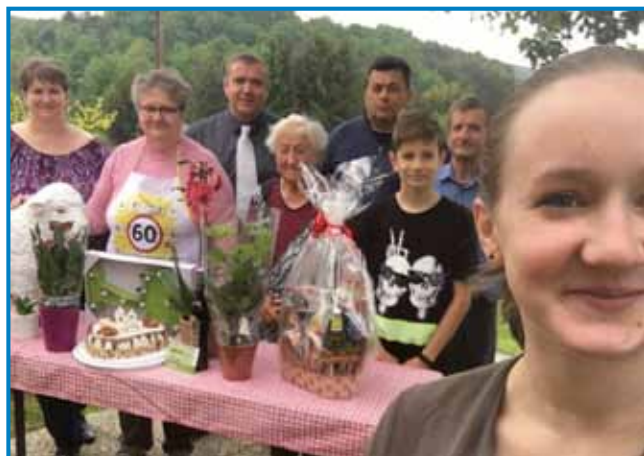
Na ženinom 60-om rojstnom dnevi

ta smo naredli iz gob, depa nej iz tjüpleni, iz tisti, ka smo nabrali na letališči. Kak sem že pravo, tam paulak je bilau letališče za veltje mašine, depa bili so mali tū, taši športni. Tam so se birke pasle pa za njimi, gde so one odle, so fejst rasle te male gobe. Mi smo te gorapobrali pa smo lopau eden dober pörkölt na-