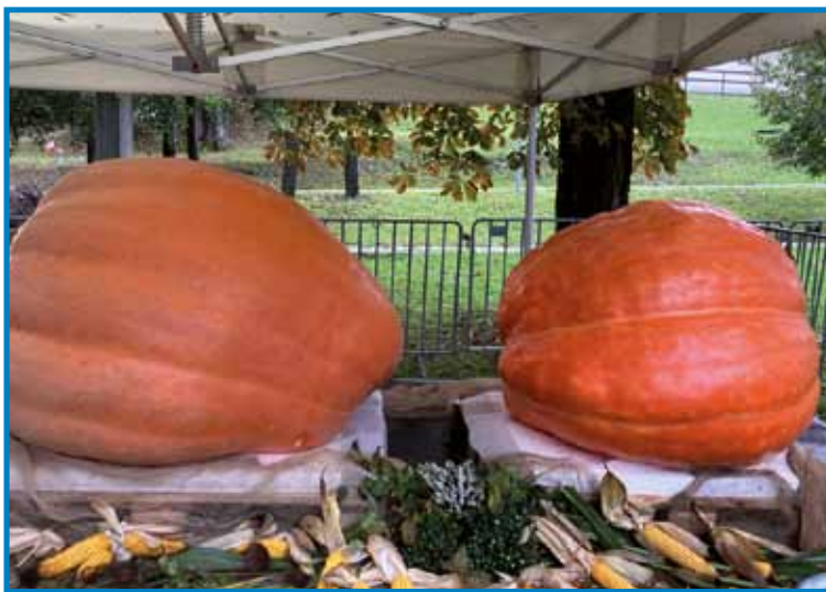
Buči, ki sta bili razstavljeni na festivalu v Óriszentpéteru

Ádám Vajda iz Sakalovcev ima ne-navaden konjiček. V prostem času se namreč že dve leti resneje ukvarja z gojenjem buč velikank. Leta 2021 je prvič nastopal na 17. festivalu buč v Órségu z bučo velikanko, ki je tehtala 180,9 kilograma. V letošnjem letu pa mu je uspelo vzgojiti kar dve buči velikanki. Prva je tehtala 320, druga pa 465 kilogramov. Organizatorji so ga tudi letos privabili k sodelovanju na festivalu buč v Órségu, kjer je dobil naziv