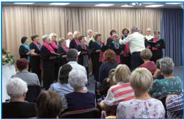
Mešani pevski zbor Slovenski dom iz Zagreba poje slovenske ljudske, tradicionalne in umetne pesmi – letos praznuje 90-letnico delovanja.