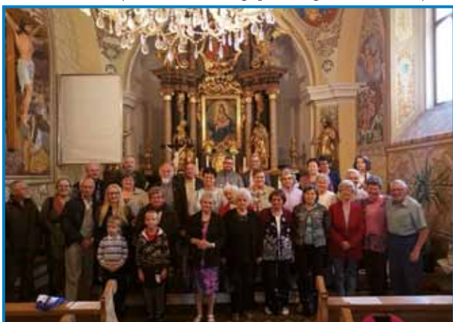
Romarji po maši v cerkvi v Dolencih