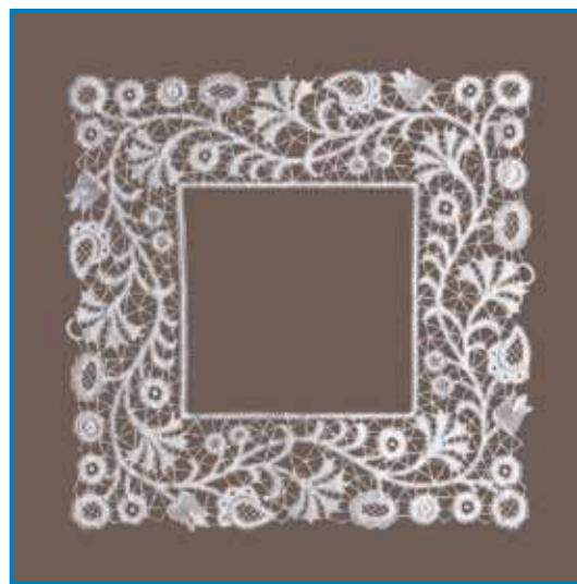
Klekljana čipka kot okvir

ne zadošča zgolj usvajanje klekljarskih veščin in tradicionalnih elementov. Prav tako (ali morda še bolj) so pomembni medsebojno družjenje, spodbujanje ustvarjalnosti klekljaric in zavest, da lahko članice v okviru Društva veliko pripomorejo k razvoju idrijske čipke in ustvarjanju novih trendov. Pravijo, da če izdelkov iz idrijske čipke ne bodo prilagajali vsakodnevnim potrebam, se bo povprečna starost klekljaric na idrijskem povečevala, klekljalo pa se bo le še zaradi klekljanja samega. Čipka v