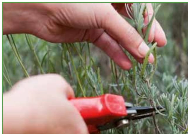
September je čas, ko opravimo zadnji rez pri sivki, odrezane vršičke pa porabimo za potaknjence

toje postavimo v senčen prostor in skrbimo za redno rosenje, s katerim vzdržujemo visoko rela-