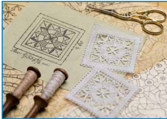
Načrt, orodje in čipke

iz izkušenj nešteti generacij so njihova oblikovana dela dragocenost, saj nagovarjajo vse čute in omogočajo doživljanje domačnosti in počasnega, zdravnega toka časa. Viden ne preseneča, saj klekljarice že nekaj časa ugotavljajo, da za ohranjanje tradicije klekljanja idrijske čipke