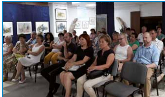
Za predstavitev publikacije je bilo precejšnje zanimanje

žnosti in začeti naše vrednote ohraniti pravočasno. »Moramo delati na tem, da tiste informacije, izkušnje in tisti zakladi, ki jih še danes imamo, ne bi izg-