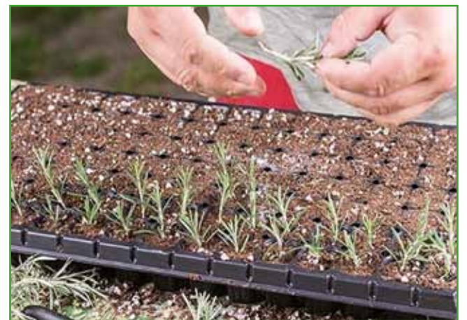
Z dopusta prineseni rožmarin uporabimo za potaknjence

ne zemlje. Potaknjencev nikoli ne potikamo samo v substrate, ki so namenjeni sajenju rastlin, saj ti vsebujejo preveč hranilnih snovi. Za uspešno ukoreninjenje je najbolje, da s substratom za potaknjence napolnimo setvene platoje, ki smo jih v letošnjem letu verjetno že uporabili za različne sejance. Lahko pa uporabimo plastične, glinene ali šotne lončke. Pri izbiri lončkov je treba paziti le