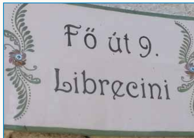
Šör, depa samo v nedelo stran 8