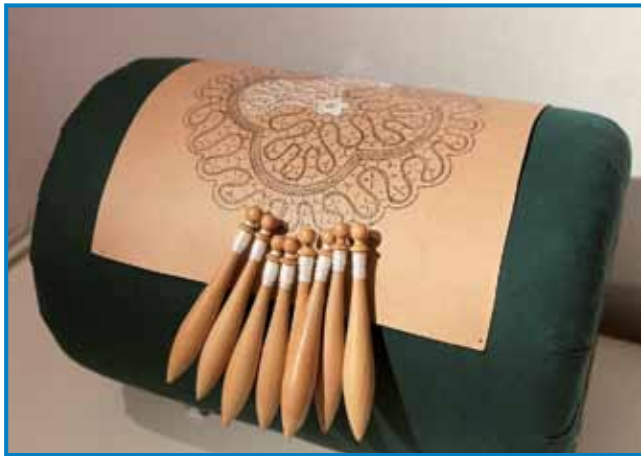
Čipke s kleklji

Klekljarska obrt se je v Evropi začela že v srednjem veku, ko so čipke postale modna dragocenost za dvore in visoko družbo. Klekljanje čipk je danes razširjeno po vsej Sloveniji in večina ljudi to dejavnost še vedno povezuje z Idrijo, Žirmi in Železniki. Prvi znani dokument o idrij-