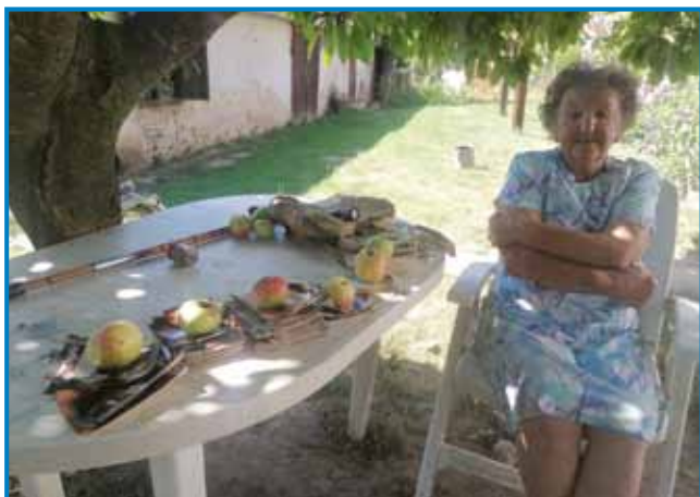
Librecina Irinka na dvauri pod tulipanovcom (magnolija), gde je vsigdar fanj sejnca

»Bilau, te gda sem v Soproni delala na tjojnji. Moja sestra