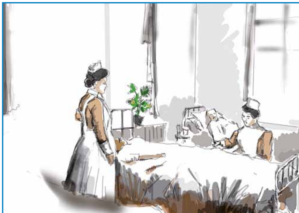
Vilma Hugonnai se je dosta trüdila za tau, ka bi se leko na Vogrskom ženske tö vönävčile za doktorce

je mogla pomagati betežnikom, ka bi leko gordržala svojo držino. Tistoga ipa je vödala pisanje »Ženske v službaj«, v šterom je terdjala šaulsko reformo. Cuj je bila pri vsakšoj organizaciji, štera se je trüdila za enakopravnost žensek.