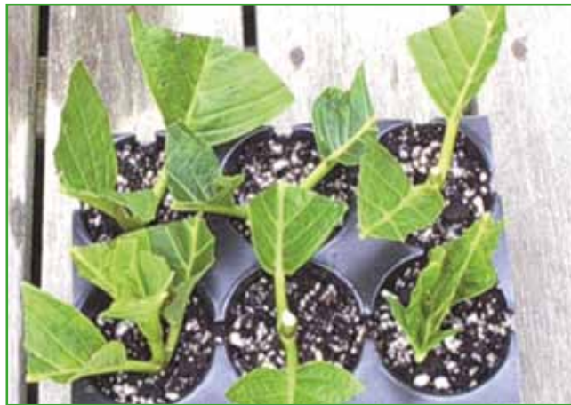
Nad vse priljubljene hortenzije razmnožujemo tako, da odstranimo najprej cvet in nekoliko skrajšamo vrh poganjka in prikrajšamo listje

Ljubitelji rastlinja najpogosteje pripravljajo potaknjence balkonskih rastlin. Pri pripravi zelenih potaknjencev moramo ohraniti dva do tri kolenca. Pod spodnjim kolencem naredimo z ostrim nožem raven gladek rez. Zaradi izhlapevanja in posledično izgube vode je pri vseh potaknjencih dobro odstraniti odvečne liste, druge pa prikrajšati. Pri razmnoževanju s potaknjenci je treba spodbuditi razvoj korenin. Priporočljivo je, da uporabimo rhizopon, to je hormon, ki pospešuje razvoj korenin. Največkrat se zgodi, da ljubitelji rastlinja uspešno pripravijo potaknjence, vendar pretiravajo z zalivanjem. Ko se potaknjenci uko-