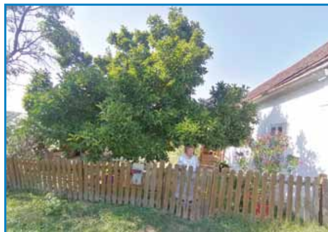
Velka drejva kralüje na dvorišči Librecine iže

njega prišlo pa vse mi je rokau vtjöpzgrejzo, tak ka v špitala sem prejšla. Zaman sem ga šanalivala, pozvali smo koršmita, dau ma je edno inekcijo pa je zaspo. Zdaj, ka nega več psa, zdaj je pa prišla lasica pa edno nauč cejle kokauši morejla, nika odnesla, drüge je vse tamnjala. Tak ka zdaj sem cejlak sama ostala tøj pri rami. Dva