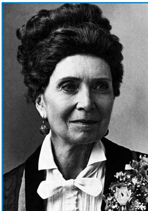
Prva madžarska padarkinja Vilma Hugonnai (1847-1922)

Vilmi Hugonnai je nej ostalo drügo, napravila je vižgo za veške babe in začnila opravlati tau službo. Njeni zakon s prvim možaum je na nikoj prišo, razpitala sta se v njenom 42. leti. Padarkinja brezi diplome