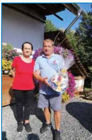
Štirideset lejt pri Pevskom zbori... stran 5