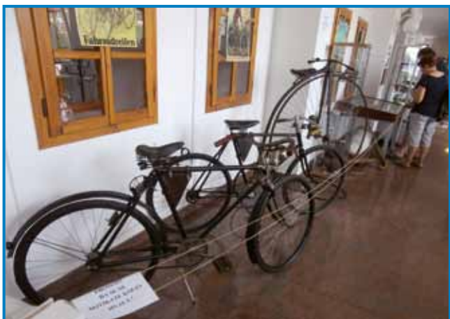
V predverju lendavske gledališke in koncertne dvorane bo razstava na ogled do 5. septembra

dveh koles iz leta 1920 je bil nekdanji serviser koles v Lendavi. Lastniki koles so morali imeti izkaznico, ki so jim jo vsako leto potrdili, ter registrsko tablico na kolesu. Podžupan, ki opravlja funk-