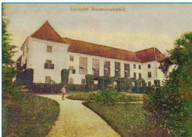
Dobrai se je vtaupo v Ledavi stran 4

PREDSTAVILI SO PUBLIKACIJO, KI OBISKOVALCE VABI NA PUSTOLOVSKI IZLET