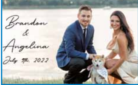
V ZDA smo šli na bratrančovo poroko

vati tja, na drugo stran sveta, da praznujem skupaj z družino poroko sorodnika,