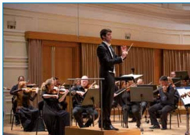
Zasledivle svoje senje stran 6