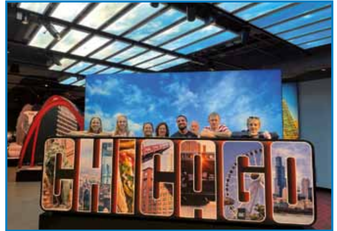
Stanovali smo pri sorodnikih v Chicagu

ke unikate, kot so deep-dish pica, Chicago hotdog, jedi na žaru in ogromno palačink ter krofov.