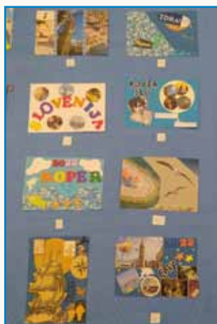
Vrnitev v Koper... stran 5