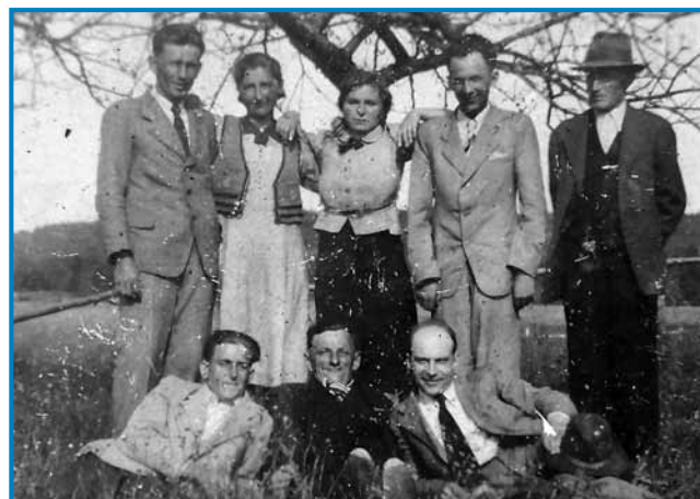
Indasvejta, gda so se lidgé dali slikati, so se oblekli v svoje najlepše gvante

»Zato so redli tjejpje, aj majo za spomin, zavolo toga, gda so se doladjemali, vsigdar so se v