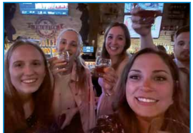
Vesela mladina z ene in druge strani »velike luže«

Ta pot mi je pokazala, da ljudje lahko ostanejo povezani tudi takrat, ko živijo več tisoč kilometrov daleč drug od