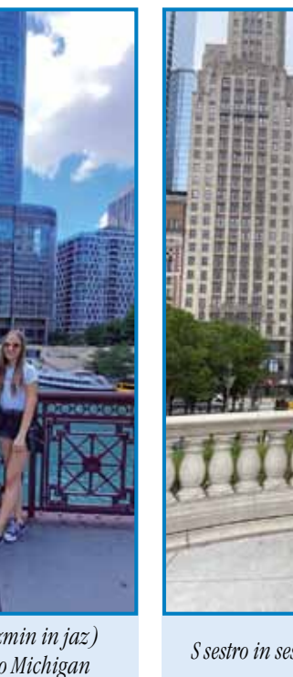
Sestro in sestrično pred džunglo nebotičnikov

madžarsko ali le zelo slabo. Skupni jezik tudi z našimi sorodniki je bila angleščina, toda nam to ni predstavljalo nobenih težav, ker s sestro govoriva angleško, torej sva staršem lahko prevedli vse informacije. Živeli smo pri očetovi sestrični, njen sin se je ženil tisti teden, ko smo bili v ZDA.