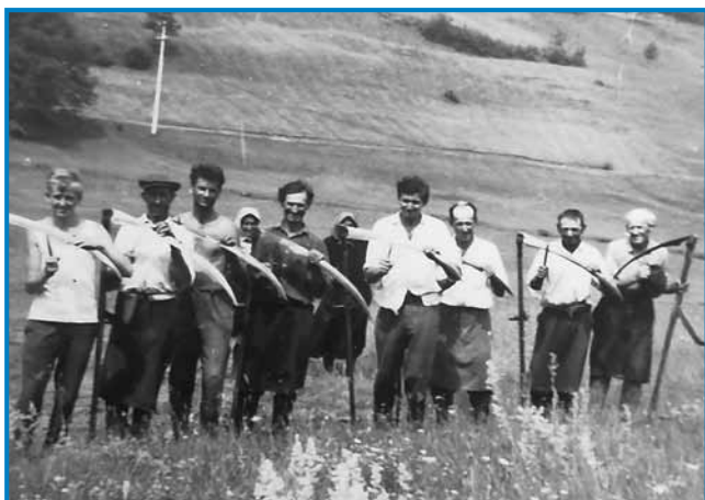
Kosci iz prejšnjoga stoletja

gde so dekile pa pojbi bili goranamalani. Na drügo stran so te lopau napisali, ka škejo pa kak radi majo deklö pa, te tau