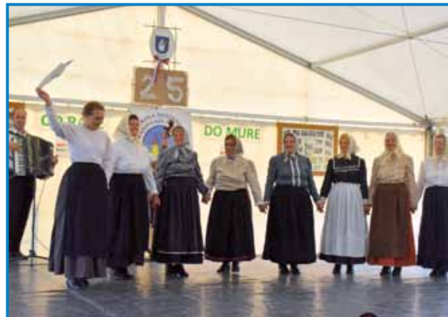
Folklorna skupina upokojenk ZSM je edina porabska folklor, v šteroj samo ženske plešejo

Na jubileji so gorstaupile eške tri gostujoče skupine. Člani goričanske bande » Što ma čas « so zaigrali tri pesmi, med šterimi