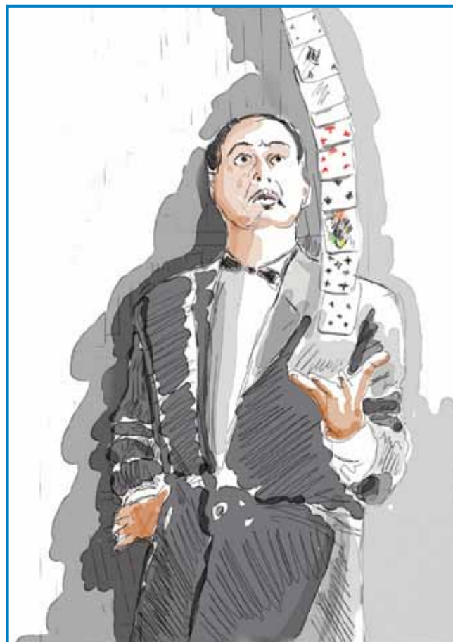
Rodolfo (Rezső Gács) je poznal blizu pet tisoč trikov, med njimi številne s kartami – še tudi po svojem sedemdesetem letu je vadil štiri ure na dan

Sloviti madžarski čarodej je napisal tudi več knjig, v katerih je celo razkrinkal nekatere svoje trike. Te izdaje so