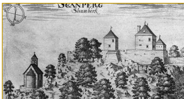
Tak je grad Šumberk nin 500 lejt nazaj vōgledo. Gnes pa samo eške ruševine se leko vidijo. Depa v njem so se tō lidge od Törkov vedli obraniti. Legenda pravi, ka spodkar v zemlej tri kadi pune z zlatom pa srebrom so djane. Depa velki črni pes, steromi iz gaubca ogen gori, je čüva. Pa eške ena velka kača ranč tak. Una zlato krauno na glavej ma, med očami pa velki dijamant njoj svejti. Steri mladi moški bi z njau vedo v božoj rejči pripovejdati, bi zlato pa srebro daubo, kača pa bi tak nagnauk lejpa kralica gratala

mejterov viskom bregej so tō velke ognje kürili. Že se v vūjaj čüje,