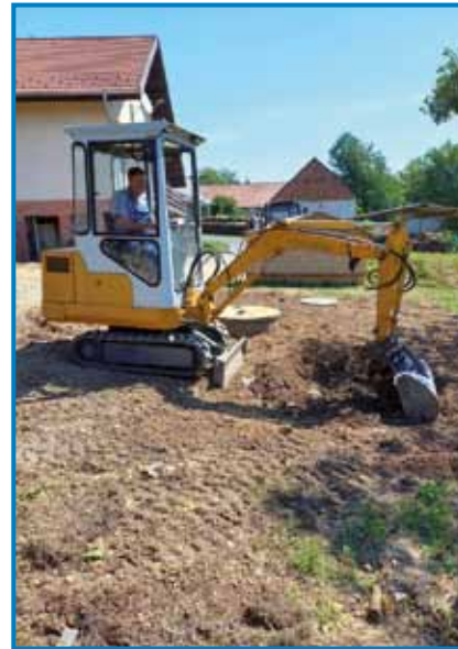
Rad pomaga vesi Števanovci tū kak zdaj, gda se je kanalizacija zateknila

ko de ma trbelo. Ne morem prajti, ka bi nej emo dela. Leko povejm, ka sem v devetdeseti lejtaj – te mi je šlau najbola – telko dela emo, ka bi leko emo 5-6 delavcov. Ne