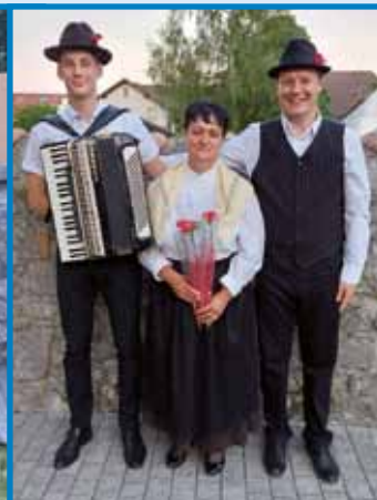
Komorni pevski zbor iz Monoštra in Porabski trio sta konec tedna preživela v Logatcu med prijaznimi gostitelji

igrišče s pevkami in pevci, ki so navdušeno zapeli skupaj slovenske pesmi. Člani zbora so si med potjo ogledali Šmartinsko jezero in reko Krko.