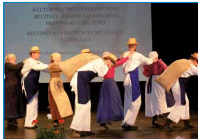
Članska folklorna skupina KUD Beltinci je nastopila z odrsko postavitvijo Mlinar

V lendavski gledališki in koncertni dvorani je na regijskem srečanju odraslih folklornih skupin nastopilo šest folklornih skupin iz vzhodne Slovenije; štiri so bile iz Pomurja, dve pa iz Maribora.