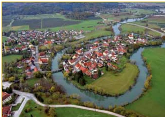
Kostanjevica. Gedro staroga varaša na otoki srejdi Krke stodji. Depa té otok so lidge napravili. Vejmo, če stoj šké nut v varaš vdariti, voda ga leko dojstavi. Kak smo že v Brežicaj vidli, so kaulak Kostanjevice tö Törki bisneli

je, ka je tau zavolo kostanov prišlo. Depa teorija nam neka drugo pripovejda. Oča tomi aj