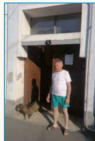
V Andovce domau dem stran 8