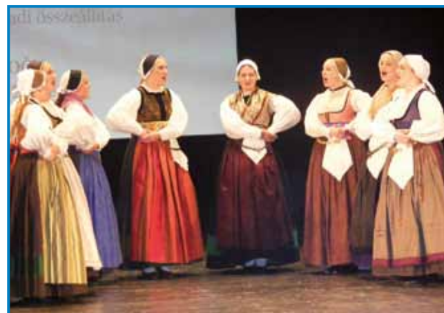
Nastopila je tudi Akademska folklorna skupina Študent iz Maribora

Na regijsko srečanje so se uvrstile tiste folklorne skupine, ki so bile najbolj ocenjene na območnih srečanjih. Obiskovalce kulturnega