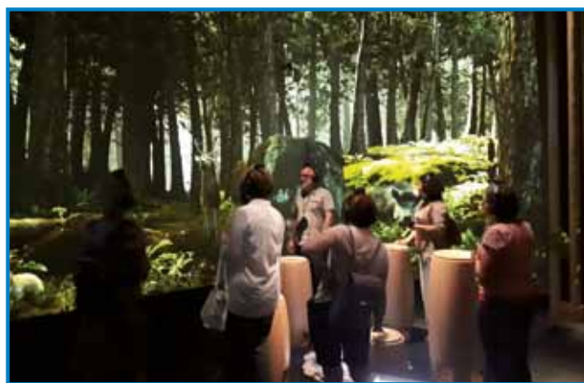
V Hiši madžarske glasbe smo se poglobljali v svet zvokov

in izvajalce. Ko smo končali s sprehodom, se je v naš um in dušo vrezalo veliko glasov.