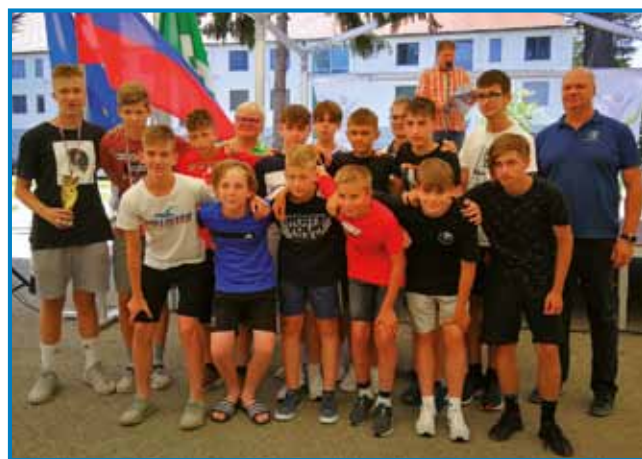
Mladi nogometaši monoštrskega kluba na Srečanju zamejskih mladih športnikov v Kidričevem (A. Kovács)

FEST. Srečanja folklornih skupin se je udeležila tudi sakalovska