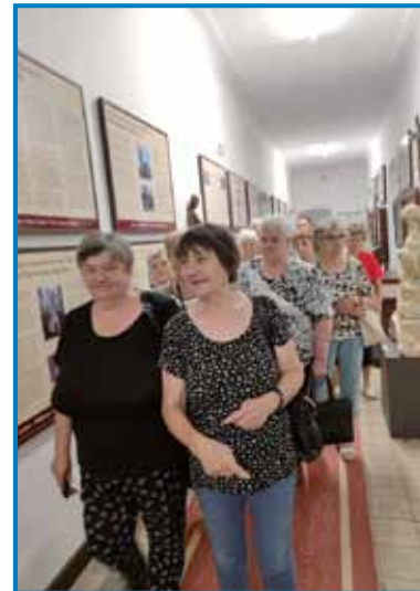
Na lendavskom gradi

Za romanje smo dobili finančno pomauč od vogrske vlade, od Urada predsednika vlade s tehnično pomočjauv Sklada