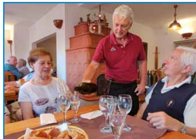
V vinotoči nam je trno šmejkalo vino

Gábor Bethlen. Člani društva smo vcujplačali za obed, bilau nas je 52 pa člani cerkvenoga pevskoga zbora. Program je biu trno bogati, meli smo versko (cerkveno), kulturno in kulnarično izkušnjo. Dobro smo