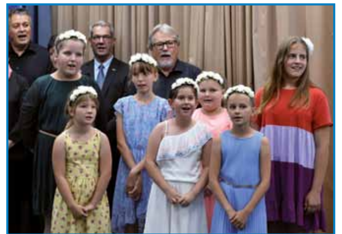
Seniške sinice so imele pomembno vlogo na svečanosti – peele so samostojno in za spremljavo, tako ljudske kot umetne pesmi

cvetic, v njem so sodelovali učenci obeh porabskih dvoje-