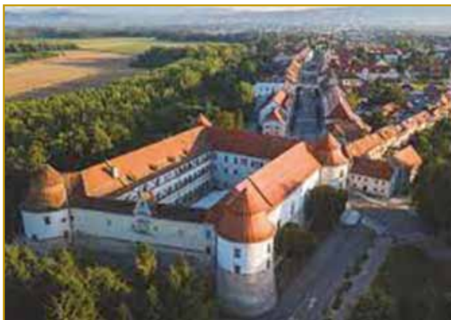
Grad više varaša je eden najlepši v Sloveniji. V dokumentaj se od njega oprvin 1249. leta piše. Se je pa v njem pa kaulak njega dosta vsega godilo. Dosta krvi ga je namakalo.

krat po Brežicaj bisneli. Kaulak cejloga varaša so stejne stale, depa skur vsigdar so nut v Brežice vdarili. Eške prva so slejgnjo paut po krajini bisneli, so se pavri zdignoli. Nazadnje smo od kmejščkoga pun-