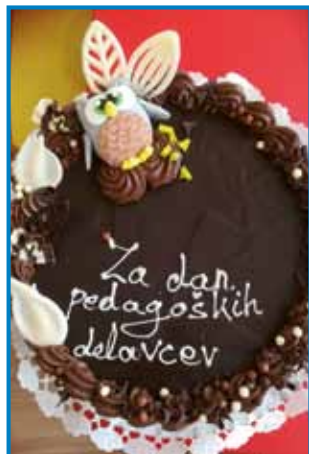
Na torti »modra« sova kot simbol znanja