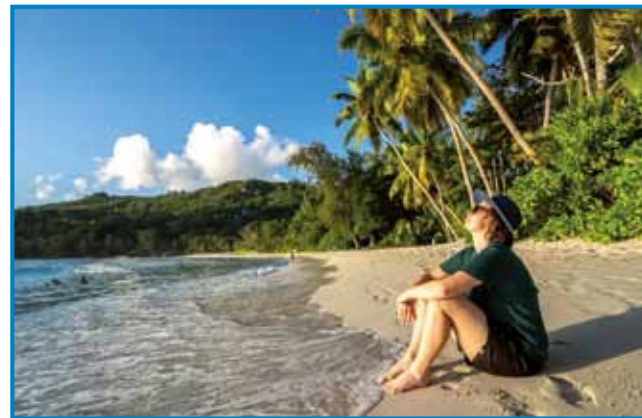
Na rajski plaži

manji lidge živejo,« je povedala sogovornica, stera je vösprobala, kak se je kaupati na rajskih plažaj, pauleg toga pa je koštavala rum Takamaka, steroga delajo tüdi iz kokosa: »Vidla sam pla-