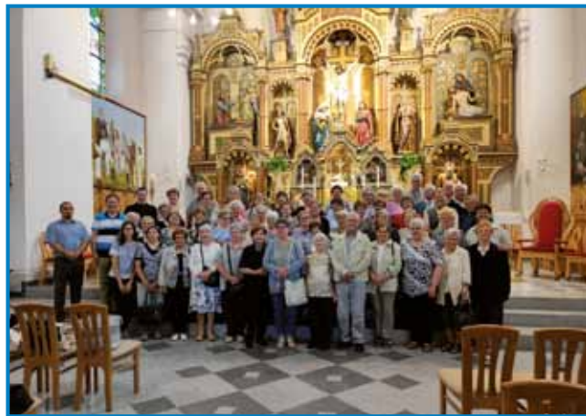
Naša skupina v črenšovski cerkvi

Društvo porabskih slovenskih upokojencev ma dostafele programov. Med tejni je eden glavni program romanje in izlet. Juniuša smo se podali na paut, pelali smo se v Črenšovce, Lendavo, Lenti in Šalovce. Hvala