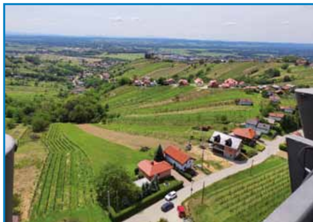
Razgled s torma Vinarium

Baugi, dosta nas je vküpprišlo, pelali smo se z velkim pa malim avtobusom. Vrejmen je lejpo bilau, program pa preveč bogati. Najprva smo se stavili pri cerkvi sv. Križa v Črenšovcaj. Tau cerkev so kauli 1322 zidali pa go dostafart obnovili. Gnešnjo