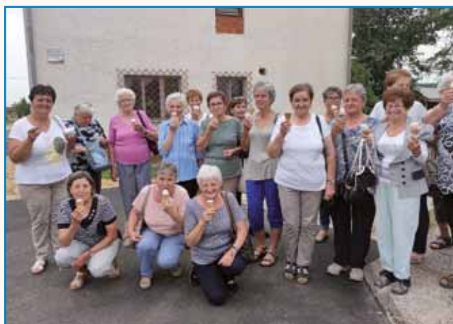
Romanje v Slovenijo stran 6