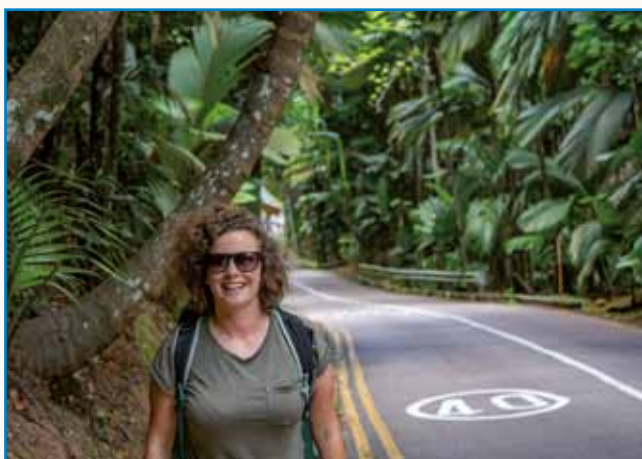
»Ges tak brodim, ka mamu mi raj na Zemli« stran 4