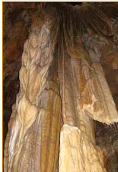
V Kostanjeviški jami takšo lepoto tö leko vidimo. Do gnes je njeni 2 km tau poznani, depa speologi eške tadale iškejo. Pravijo, ka je eške dukša, kak jo do zdaj poznajo

grato. Njega so pa - kak v Monoštri - bratje cistercijanci gorpostavili. Pa tau tö skur v gnakom časi se je godilo, kak je tau v Monoštri bilau. Že 1252. leta se od Kostanjevice kak od varaša guči. Ja, trno brž je vseküper šlau. Depa zdaj smo več nej v krajini Posavje. Kostanjevica že v krajini Dolenjska stodji. Smo pa že pri enom problemu ali dilemi, če šketi. Odkejc je tau ménje Kostanjevica se narodilo. Prvo, ka bi komi na pamet spadnolo,