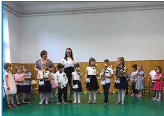
Slovo od velikih otrok. Vrtec Gornji Senik

V vrtcih Števanovci in Gornji Senik smo v začetku junija pripravili zaključno slovesnost za najstarejše otroke, ki gredo v šolo, njihove starše in otroke, ki bodo v prihodnje še obiskovali vrtec. Otroci so se predstavili s pristrčnim programom. Manjkalo ni