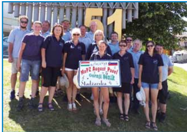
Člani MePZ Avgust Pavel z Gornjega Senika pred logom Tabora slovenskih pevskih zborov v Šentvidu pri Stični

Ráckeve je kraj na Madžarskem, kjer živi tudi srbska manjšina. 18. junija so tam priredili kulturno manifestacijo z naslovom KEVE-