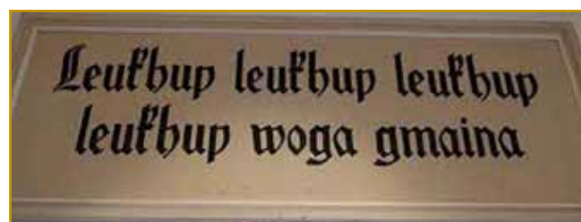
Tak so prve tiskane (druknivane) slovenske rejči vögledale. 1515. leta so ga sodacke dobili, steri so se prauti pavrom šli bojnat. Tau so zatoga volo dobili, ka do vedli, steri pavri popejvajo: Le vkup, uboga gmajna! Vse tiste je trbelo zgrabiti ali pa bujiti. Iz toga je eške gnes vsem poznana nauta vöprišla. V toj nauti je verz »stara pravda« tö, od toga nam pripovejda, ka pavri so se za stare regule gorgemali. Za tisto staro pravdo, regulo, od steri so njigvi gospaudje nika nej čüti škeli. Zatoga volo tö ji je vanugo v krvi svoje življenje skončalo.

ta pa od Matije Gubca pisali. Depa punt iz leta 1515 je eške vekši biu. V njem se je kaulak 80 000 pavrov za »stara pravdo« bojnal. Pet mejsecov se je té krvavi bal godiu. Po vsej slovenski krajinaj so se pavri