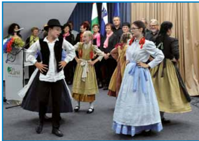
»Mravla je v mlin pelala« - člani otroške folklorne skupine DOŠ Števanovci so predstavili splet prekmursko-porabskih plesov

svojo samostojno in neodvisno matično državo. Letošnji »rojstni dan Slovenije« so v Monoštru – v soorganizaciji Generalnega konzulata RS in Zveze Slovencev na Madžarskem – proslavili 22. junija, konferenčna dvorana Slovenskega doma se je do zadnjega kotička napolnila z gosti z obeh strani meje.