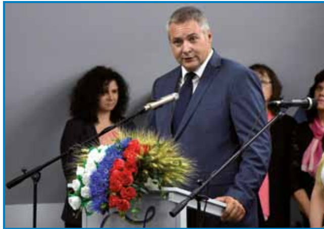
Slavnostni govornik, državni sekretar mag. Dejan Židan: »Slovenija se trudi za razvoj porabske slovenske in pomurske madžarske skupnosti«