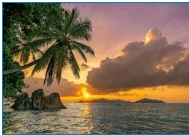
Sončni zahod na Sejšelih

bili po tistom, ka je s fligarom priletejala nazaj v Evropo, vej pa je neka cajta preživela na Sejšelih ali kak se uradno pravi tomi rosagi Republika Sejšeli. Tau je otoški rosag v Indijskom oceani, steri leži okauli 1600 kilometrov vkraj od celinske Afrike, nej daleč vkraj pa so ške otoki Madagaskar, Mauritius, Reunion in Mal-