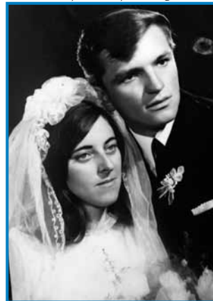
Ani pa njeni mauž, gda sta se zdala pa gda sta ešče samo pajdaša bila

»Gda so te tjejp napravili, potistim nejnadudja so ga Rusi