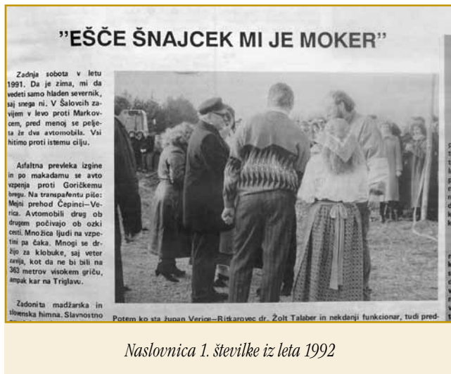
Naslovnica 1. številke iz leta 1992

letno bilanco o tem, kaj so naredili in kaj bi lahko bolje naredili. Žal so tudi takšni, ki bi najraje še živeli v letu 1991, ko so še imeli službo in ko so družinski dohodki še zadostovali za normalno življenje. Kaj bo pa prineslo novo leto Porabskim Slovencev, še ne vemo natančno. In to je menda tudi dobro, saj smo vsaj do prvega razočaranja lahko optimisti. Zveza Slovencev čaka narodnostni zakon, proračun za leto, 92 in odprtje mejnega prehoda Gornji Senik-Martinje. Del Porabskih Slovencev, ki so leta in leta pridno delali v monoštrskih tovarnah, pa med tem izgublja svoje službe. Mi, ki imamo vsaj službe, pomagajmo vsem tistim, ki so v stiski, in tistim, ki so tega potrebni. Pa vseeno mi dovolite, da zaželim vsakemu bralcu Porabja srečnejše novo leto, kot je bilo leto '91.« Francek Mukič pa je piso o slovenskih oddajah na györskom radioni: »Sprvoga, pred več kak desetimi lejtami, je žmetno bilau slovenski program