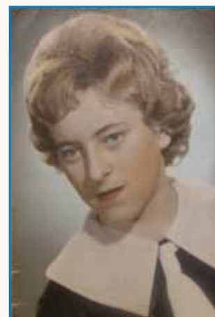
Bola samo lejpi spomini ostanejo stran 8