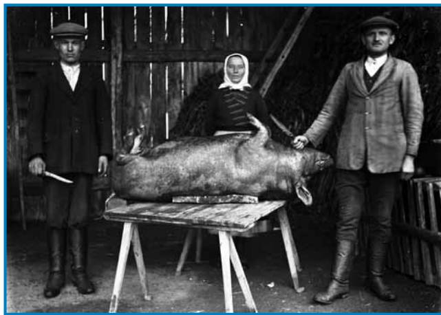
Kejp, steri je biu napravljeni med obema svetovnjima bojnama na zabadanji na Goričkom, si leko poglednete na vilični razstavi v Murski Soboti

žmetno delati. Tudi o tom gučimo na razstavi. Notpokazemo tudi dosta predmetov, posaude, pa druge škeri, stere so se v kūnji nūcale. Inda sveta so pekli v lončenom maudli, gnesden pa v bauti leko gesti kūpimo vkūper z embalažo. Sploj deci sam stejla pokazati,