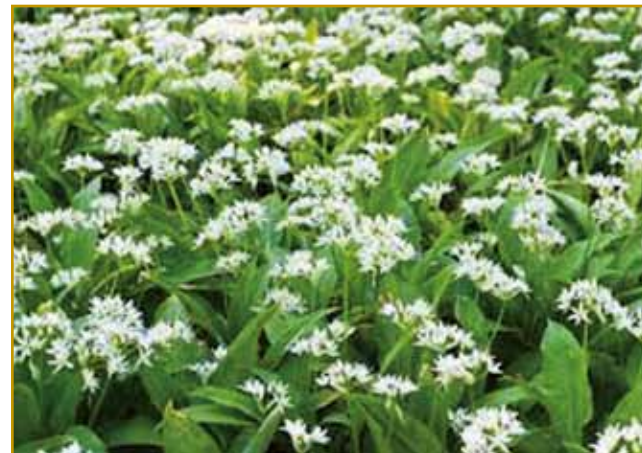
V aprili v logaj skrak vode na velke čemaž ali medvedov česnek raste. Po tejm takši diš kaulak dé, kak bi človek v česnekovo župo nut spadno

toga volo, ka naši stari so kose eške nej poznali, s srpom se je želo. Logično je, ka nin mora tö velki spran biti. Ja, mejsec avgust je velki srpan, v njem se že na velki krma kosi, se na paulaj ženje. Ovak pa eno pa drugo gnešnje poznano ménje julij pa avgust iz