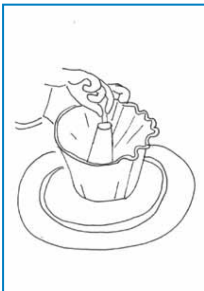
Lončar z nogauw süče šajbo, na šteroj z rokami rédi pekač za kuglof

Pred prvov svetovnov bojnov je bilau na Slovenskom zvün tkalcov največ lončarov, šteri so se spravljali z ednov trnok starov meštrijov. Tau vejmo s toga, ka so slovenski arheologi