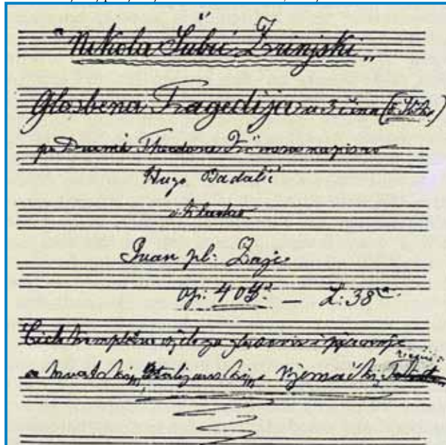
Rokopis naslovnice Zajčeve glasbene tragedije, opere Nikola Šubić Zrinjski (1876)

Glavni Zajčev pomen za razvoj hrvaške glasbe je v tem, da je v času, ko je na Hrvaškem na