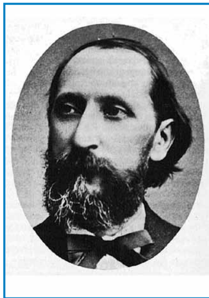
Skladatelj in dirigent Ivan pl. Zajc (1832-1914)

slika bitko pri Szigetváru v županiji Baranja leta 1566. V njej