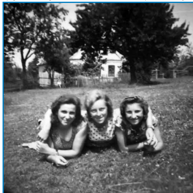
Tri padaškinje iz Andovec

pomauč skočilo. Gnesden, tak mislim, tašo že več nega, pa če Andovce gledamo, ranč domanjoga lüstva nega.«