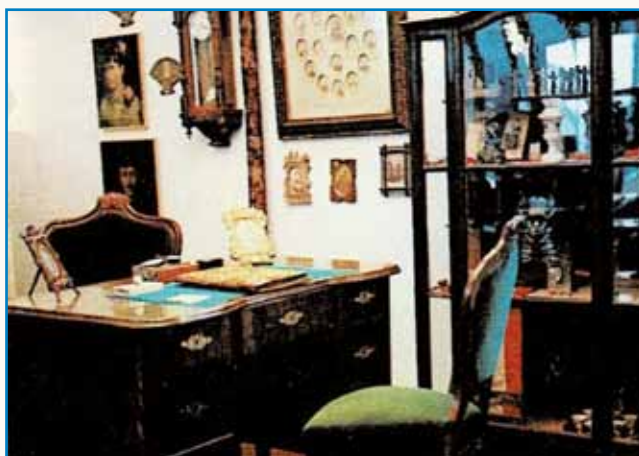
MADŽARSKI, HRVAŠKI IN SLOVENSKI GLASBENIKI SKOZI ČAS... stran 7