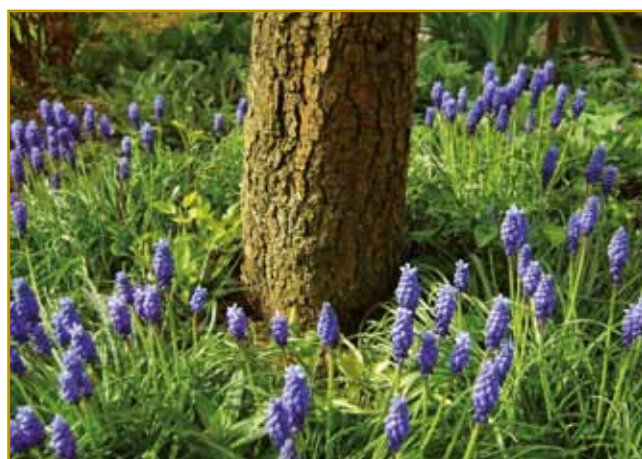
Našo staro ménje za apriliš se je tö iz vegetacije »narodilo«: mali traven

krajinaj je tretji mejsec se tak zvau. Süsec od toga pripovejda, ka snejg se že topiu, süja zemla pod njim