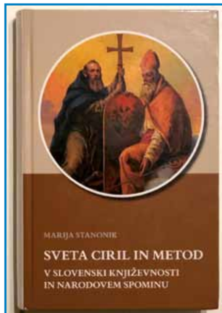
Sveta solunska brata sta postavila temelje slovenski književnosti in kulturi – bistveno sta zaznamovala tudi slovensko narodno identiteto

dramatik se avtorica ne omeji le na dramska dela v ožjem pomenu besede, temveč se posveti