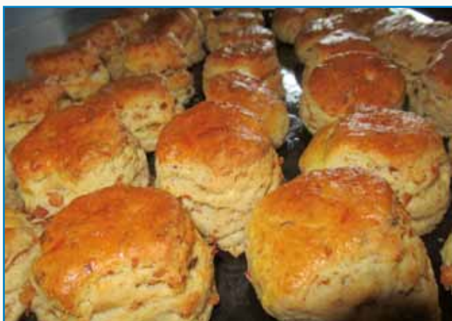
Inda sveta so lidge znali poštvovati hrano stran 4