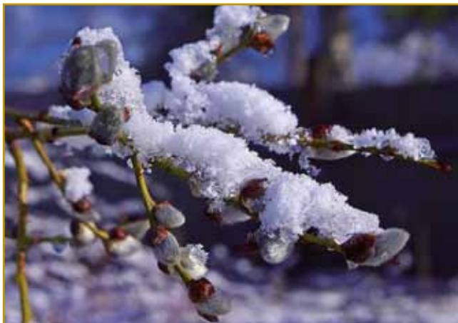
V tretjom mejseci se sprtoletjt začne, depa kakši snejg leko eške vsigdar spadne

Od zime do sprtoletjta Pa smo znauva pri tom, Gnesden se prvi mejsec v ka süsec v drugi slovenski