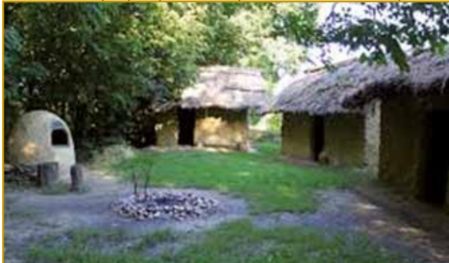
Gnes na istom mesti so en tau indašnje vesi njeno rekonstrukcijo napravili. Turisti se trno radi tam stavljajo. Leko si poglednejo, kak so lidgé 5500 lejt nazaj živeli. Vej se zgoditi, ka domanji lidgé vam eške takši krüj spečejo, kak so ga indasvejta delali

živeli. Gvüšno, ka svoje njive so meli, depa skrak vesi voda teče. Gvüšno, ka ribe so si lovili, divjačino tó, meli pa so že svoje domanje živali. Srejdri vesi se je v zemlej velki čaren kraug pokazo. Gda so tadale kopali, zemlo strüjgali, so gorprišli, ka je tam velka peč stala. Velka peč, v steroj so si krüj pekli, mesau pa ribe tó. Takšo se reisan na