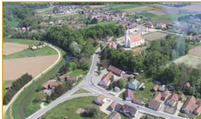
Gda se z oblakov doj pogledne, se vidi, ka poštije so kak eden križ vküper napelane. Tam se križajo, križ naredijo pa se tak ves, ka iz ravnice v brgauve dé, Razkrižje zové. V Razkrižji pa v vesnicaj kaulak njega samo domanji lidgé vejo, kak granica med Slovenijo pa Hrvaško dé

velke Törki lejtali, rame gorvužigali, lidi vmarjali, ene pa za delo daleč odgnali. Depa po legendi aj bi se njim domanji podje prauti postavili, se z njimi