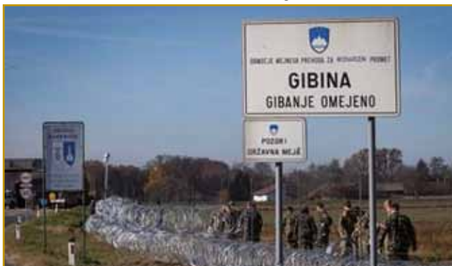
Na Razkriškem dosta staroga leko najdemo. Vcejlak nauva pa je pikejča grajka, stero je v velkom straji pred migranti slovenska soldačija postavljala. Ja, v modernoj Evropi tau trno lagvo vögleda. Kak bi nazaj v tisti čas socialističnoga pa kapitalističnoga talanja Evrope prišli. Pa tau na granici, ka je nigdar nej granica bila. Lidgé z Hrvaške pa Slovenije v toj krajini skur gnako gučijo, se med seuv ženijo, pajdaše majo, eden k drugomi ojdijo

rejci zgodi. Zvekšoga so iz tisti časov bole grobe najšli. Tau pa, ka cejlo ves najdejo, se ne zgodi tak nagausti.