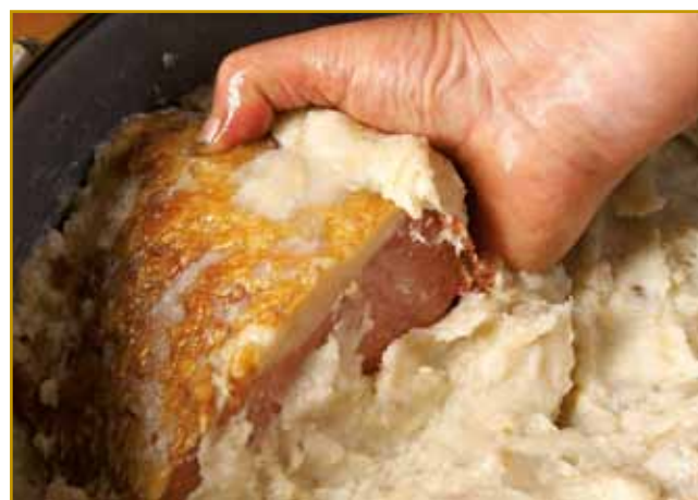
Eni tomi, po starom konzervejranomi gestiji, tünka pravijo, drugi čeber, kibla pa tibla tó, depa nej važno, kak se zové. Najbole naprej valaun je tau, ka nebesko dobro spadne

Krajina, po steroj gnes ojdimo, je vnauge gospodare mejla, vnaugi so jo škelj meti. Vküper s Prekmurjom so jo krali iz Budima za svojo meli. Hrvati so