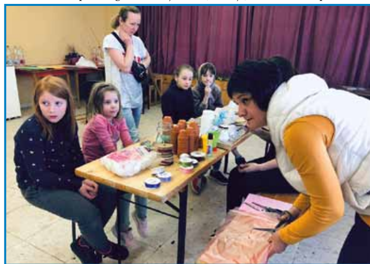
Na drüdjji den, kak so begunci prišli, v soboto na vüzemski delavnici mlada ukrajinska mati svojo čerdjauw pa njeno padaštjinjov

žensk je vtjüpprišlo, velko delo nas je čakalo. Lüstvo nam je teko vse vtjüpdalo! Od djesti, do butora (pohišta), gvante za mlajše pa völtje, posteljno pa drugo vse! Tej mladi,