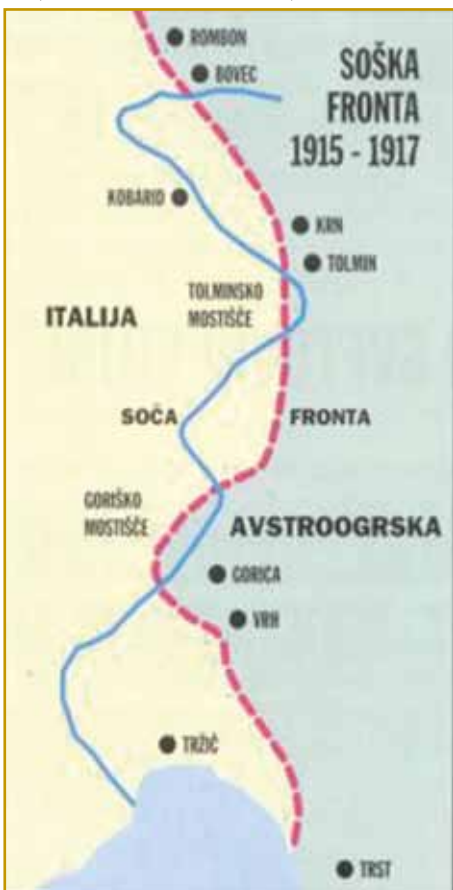
Fronta na Soči je nej vsigdar na enom pa istom mesti »stala«. V dvej pa pau lejtaj se je dostakrat vöminila

staro lüstvo, je skrak Nadiže živel. Slavi so v tau krajino prišli, za njau so se bojnali. Langobardov več nega, njiva rejč je ostanola, Slovenci pa eške itak kaulak Nadiže živejo. Nadiža staro slavsko menje ma, vejo za tau pozvani lidge prajti. Depa mi nazaj k prvi velki bojni demo, v steroj so vnaugi Slovenci mrlji, moški iz Porabja tö.