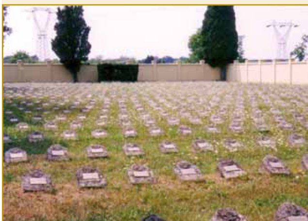
Cintor spadnjeni v prvi vojni v slovenski vesi Doberdob, stera gnes v Italiji stodji. Za tau ves se že dugo tak guči: Doberdob, slovenskih fantov grob. Doberdob pa zvekušoga vse vesi kaulak njega so v bojni do kraja uničene bile. Takši ali ovakši cintorov se eške gnes skur skrak vsikše vekše vesi leko vidi.

goraj skrak Soče se je človek obei krajaj fronte kaulak eške nigdar nej bojno. Skur 300 000 sodakov bujti bilau.