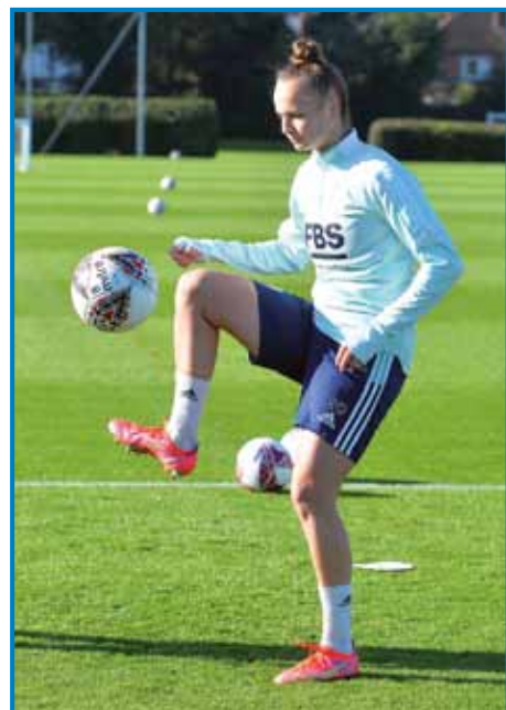
Od lanske jeseni fotbal špila v Angliji

Sogovornica ške pove, ka je nej tak kak pri moških kolegaj, gé jim, če tak povemo, vse prinesejo k riti, ona si mora sama küjati in prati, tak ka je tau dobro gé, vej pa se je navčila samostojnega žitka. Njena velka želja je, ka bi ške neka lejt profesionalno špilala fotbal, najrajši v Angliji, spoj pa za Manchester United. Če de pa prišla kakša dobra ponudba, pa ta se z agentom (ügynök) pogučala, de šla mogauče iskat svojo fotbalsko srečo tudi v kakši drugi rosag. Fotbal bi rada špilala tudi za reprezentanco. V mlašečih kategorijaj je bila tau slovenska, lani pa je