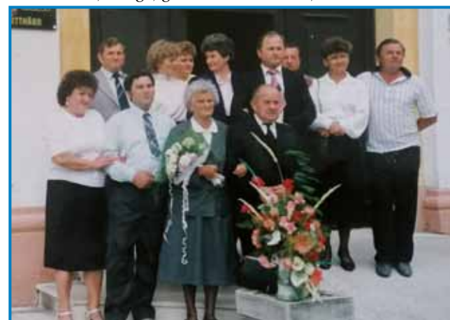
Držina na 50. oblejmnici zdavanja starišov

»Tau je zato, ka sem dja najmlajša, največkrat sem sama dolavzeta z materdjov. Na drugi tjejpaj so pa brati pa sestra dolazeti, tašoga, gde smo