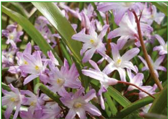
Scilla - roza veverica

Jesenske čebulnice in gomoljnice so večinoma nizke rastline, na primer jesenski žafrani, ki pridejo do izraza le na izpostavljenih nezaraščenih delih gredice.