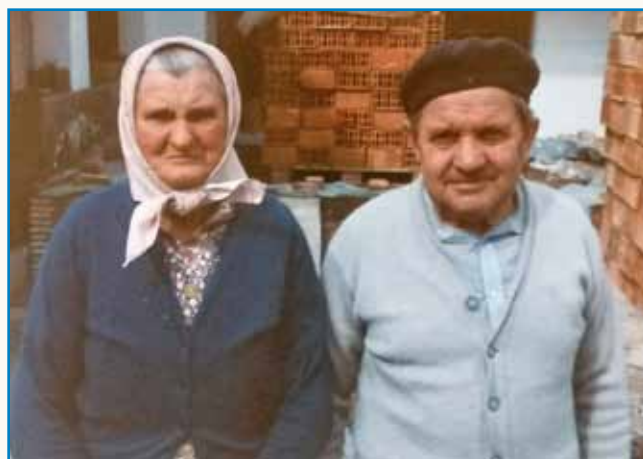
Rada mam svoj materni dzejik stran 8