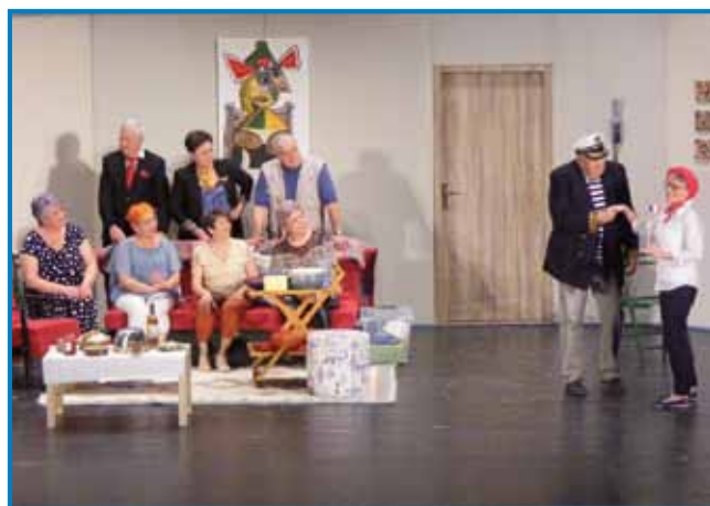
Gledališka skupina lendavskih upokojencev je uprizorila svojo šesto predstavo

nil, da je gledališka skupina v štirinajstih letih delovanja uprizorila šest gledaliških predstav za odrasle in veliko skečev, pa tudi pravljice za otroke: »Korona je v zadnjih dveh letih najbolj prizadela prav gledališko dejavnosti. A naši Kofetarji niso obupali in so se lotili priprave predstave, pri čemer jih je ves čas spodbujal režiser