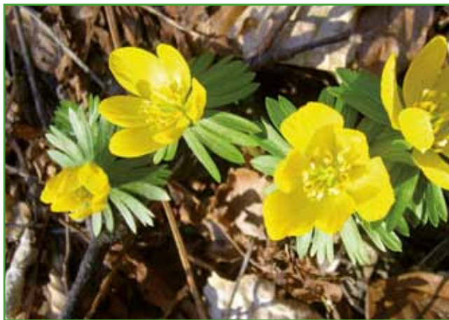
Jarica ali ozimika prva med prvimi požene cvet

ORNITHOGALUM - PTIČJE MLEKO - v umazano beli barvi je v