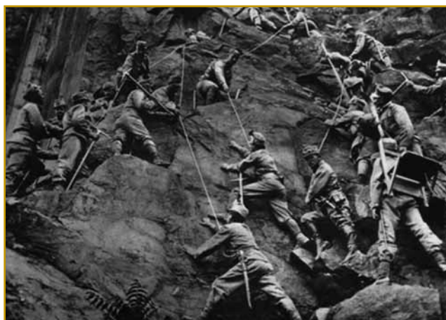
Na toj fotografiji se leko vidi, po kakšnom tereni so morali sodaki ojditi, pleziti. Tou se godi v tisti dnevaj, gda se je bitje eške kuman začnilo

v steroj so naše slovenske krajinje tö bile. Tak visko v V tej dvej pa pau lejtaj bitja na Soči pa kaulak nje je na