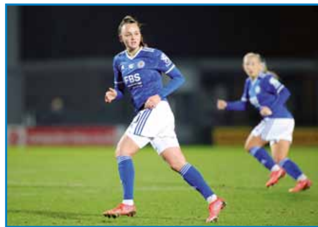
Za prvoligaško ekipo Leicester City je do zdaj odšpilala eno tekmo

Za Leicester City je do zdaj odšpilala samo eno tekmo, in tau v ligaškem pokali prauti drugi ekipi iz varaša Machester, Manchester City-ji. Čiglij so tekmo zgubile z 0:5, je bilau tau za njau eno ejkstra doživetje. »Za takše trenutke trenejraš in se mant-