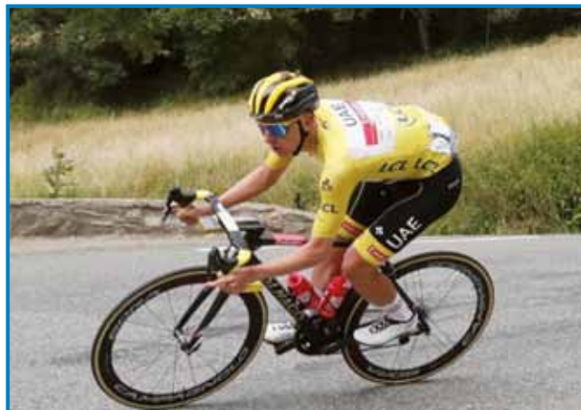
Tadej Pogačar v žuti majici, stero nosi vodilni na dirki Tour de France

Slovenija je mali rosag, vseeno pa ma dosta dobrih športnikov, v zadnjom cajti sploy med piciklisti. V toj rubriki smo že predstavili Pri-