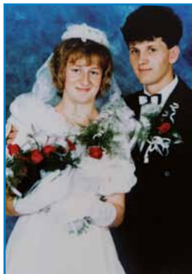
Zdavanjski kejp iz leta 1990

»Ne vejim, ka se je zdaj zgodilo, ge dvajsti lejt delam doma, depa telko dela je še nikdar nej bilau