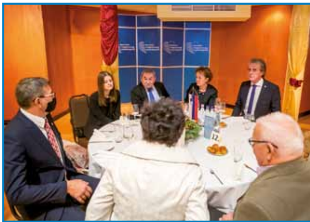
Na sprejemu v Bolgarskem kulturnem centru

- V zadnjih tridesetih letih se je marsikaj dogajalo v slovenski skupnosti na Madžarskem. Kateri so tisti rezultati, katere so tiste pridobitve, s katerimi se lahko pohvalimo, če se primerjamo z osta-