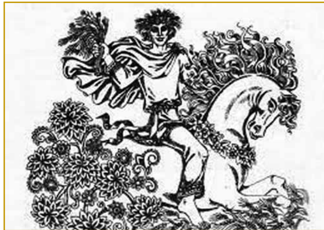
Na tom kejpi je Jarilo mladi moški, mladi kak sprtolejt, steri na konji gejdzi, za njin pa vse na nauvo vō iz zemle raste. Tej stari mit se je v bole mlajšoga o sv. Juriji vöminiu

vcejlak dojzgori. Tau pa nej njegovja vola bila, ka bi se kvar delo. Kvar človek naredi, če z ognjom ne vej delati, kak trbej. Tau več nej boža vola. Največ pa vsigdar bojna vzéme, dosta lidi vzéme pa je na drugi svejt odpela. Zato se pri kraji toga pisanja pri kakšomi imeni stavimo, ste-