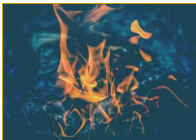
Kak ogen pa voda si prauti stodjijo, bi leko prajli za tiste, ka se nikak med seuv ne morejo razmeti. Takšiva sta Perün pa Volos bila. Pa od njiva mlajši so se tō po njima dvōma vrgli

smrti je gé. Oba se na den nauvoga leta narodita. Tak sta od njiva mama pa oča