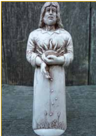
Tak aj bi Jarilo vöglejdo, depa nika mlado vō ne glejda. Leko, ka preveč brž je svoj čas življenja gor gemau. Ali pa zat takši stari pa mauder vöglejda, ka baug takši mora biti

smo tak že tō pri nejgvi funkciji. Jarilo je baug vegetacije, vsega, ka iz zemle vözrasté. Drugo, ka je iz Perüna pa Mokoše vöprišlo, je Morana. Od nje že smo pisali, boginja