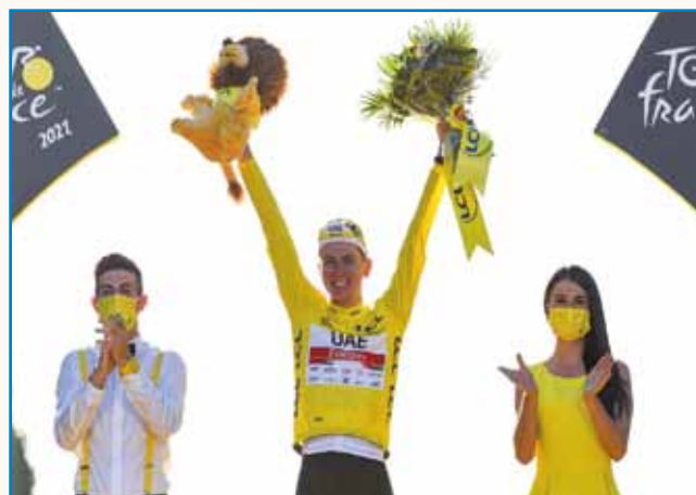
Tadej Pogačar stran 7