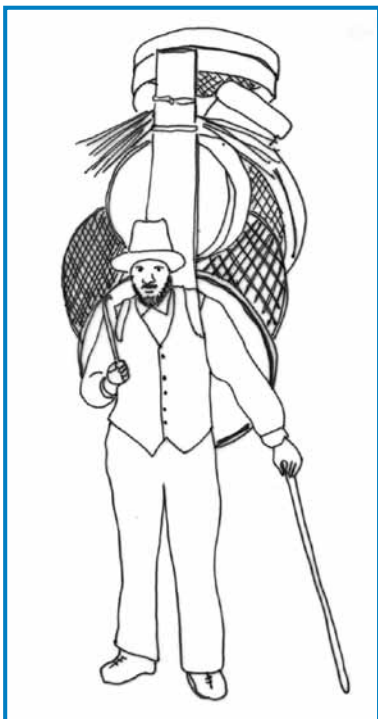
Suhorobar je svojo blago sklau v »krošnjo«, štero si je zvezo na rbet - »krošnjarge« so do svoje starosti na pauti bili

senji v bližanjoj Sodražici, v Ljubljani je bilau na začetki 20. stoletja pet, v Zagrebi pa šest bautošov s süjov robov. Kauli Ribnice je bilau kauli dvajsti takši bautošov, dosta škéri pa so odali »rešedarge« ali »krošnjarge«, šteri so furt na pauti bili. Uni so rešede na pau narédili doma, te so je pa sklali v edno krošnjo, štero so vzeli na svoj rbet. Če je nekak