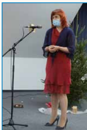
Sveji, gde je vse mogauče ... stran 6-7