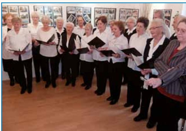
Tau samo te leko delaš, če iz srca delaš stran 3

TO JE DELO, KI GA LAHKO OPRAVLJAŠ DO KONCA ŽIVLJENJA