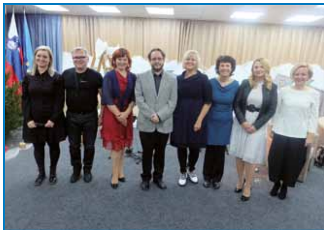
Pravljčarke, pravljčar, muzikanta, generalna konzulka pa direktorica knjižnice na gasilskom kejpi

kovanja. Pred 31. lejti 23. decembra so lidgé v Sloveniji ranč tak s pričakovanjom odišli na referendum, ka bi