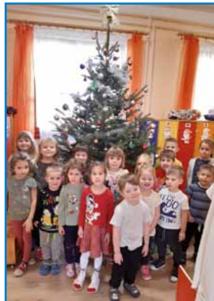
Otroci v Vrtcu Gornji Senik pred našim božičnim drevescem

Po celem vrtcu je kmalu prijetno zadišalo po božičnih piškotih, ki so jih pripravili kar otroci sami. Veseli so z modelčki izrezovali različne oblike medenega peciva. Otroke so čakala tudi darila, katera so z velikim zanimanjem odpirali. Prav tako smo izdelovali voščilnice, darila in razne drobne pozornosti za druge ter prepevali božične pesmi. Prisluhnili smo še čudovitim božičnim