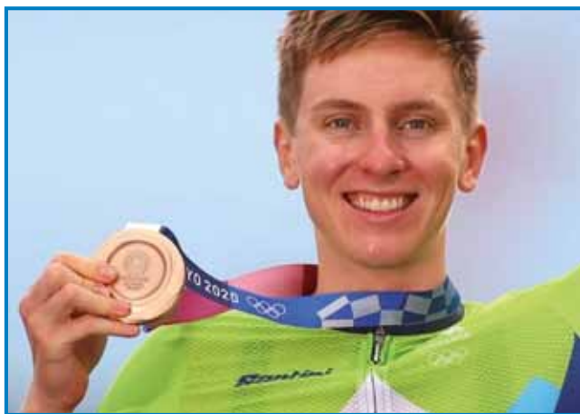
Z bronasto olimpijsko medaljo okauli šinjeka

»Piciklizem je eden najbolje žmetnih športov, zatau sta nej zadosta samo talent ali fizične predispozicije,« ške pravi dvakratni zmagovalec najbolje erične trikedenske dirke na sveti in cujda: »Moreš biti vztrajen, delaven, brez talenta tüdi nejde, pauleg toga pa