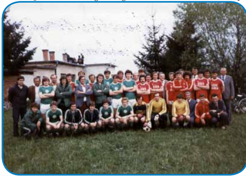
Slovenčarska nogometna ekipa je tistoga ipa špilala s Fradinom pa Haladásom tö.

- Demo malo nazaj, kama si üšo delat, gda si zgotau-