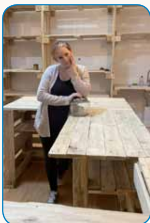
Naša bauta stran 4