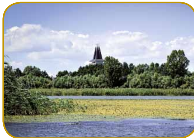
V vesnici Poroszló leko na učnoj pauti spoznavamo rastlike pa stvarine na jezери - ozajek se zdigava törem Ekocentra

Glavni varaš krajine Nagy- kunság je Karcag , štero ime v törski gezikaj »püstinska lasica« znamenüje. Daleč na- okauli je bila erična domanja čarda Morgó, štera je stala djenau na mejej med župani- jama Jász-Nagykun-Szolnok in Hajdú-Bihar. Eden betjar je od tistec leko zbejžo kama koli, pandurge pa so mogli ostati v svojoj županiji. S té čarde je v sausadno čardo Ágota prej pelo eden tunel tó. V Karcagi je bilau inda svej- ta šestdeset mlinov, od toga edenajset na vöter. Če smo že tam, se splača pogledniti maust »Zádor«, šteroga so zozidali na poštiji med Kar- cagom in Debrecenom, tau pa 21 lejt prva kak eričen hortobágyiski maust z devet lüknjami. Varaš poznamo eške po sivi omaraj domanji tišlarov in po festivali, na šterom majo šegau vsikšoga juniuša sküjati 20 gezero porcij birkečoga golaža. V