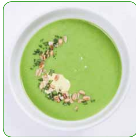
Koprivna juha

Zdravilnost kopriv je torej znana že od davnine, so zastoj in rastejo za skoraj vsako hišo. Zdravilni in uporabni so vsi deli rastline, listi, steblo, korenine in semena. Najboljše koprive za nabiranje in uživanje so spomladi, ko začnejo poganjati mlade rastlinice. Naši predniki so zelo cenili koprivni čaj iz posušenih ali svežih kopriv. Priprava je preprosta. Zavremo liter vode, ga odstavimo in poto-