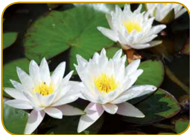
Beli lokvanj (tündérrózsa) pokrije cejlo jezera Tisza-tó, gda pride prva sprtolejtna toplina

sedla ranč tak. Gnes pela vö z varaša železniška štrejka vr- nau pauleg automobilske poš- tije – srce nam gvüšno bole naglo začne biti, gda eden šnölcug prauti nam pela. Ovak je tau mesto središče pi- ciklaškoga športa, kolesarske poš- tije kauli jezera so duge 65 kilomejterov. Drautove so-