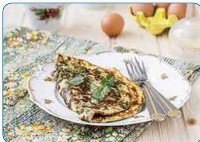
Bi jedli omako ali omeleto iz kopriv? stran 6