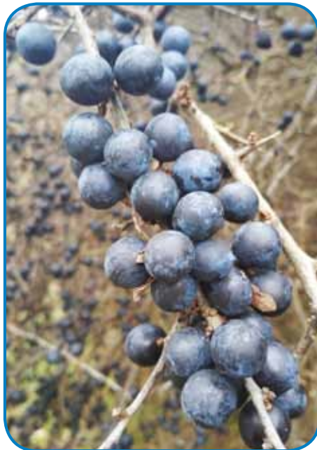
Trnulje (kőkény) je najbaukše pobrati, gda je slana že »ščipne«

lejs. Rauže pa trnulje majo dostafele zdravilni učinek (hatás). Če iz rauž skújate