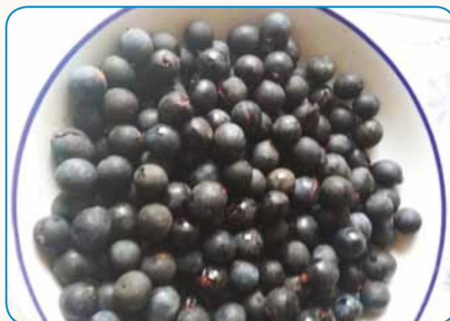
Ka vse leko naredimo iz trnine? stran 7