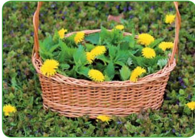
Koprivni vršički in regratovi cvetovi

Hrana iz narave je med ljubitelji kulinarčnih posebnosti vedno bolj priljubljena, pomlad pa pravi čas za nabiranje divjih rastlin. Če smo v predhodnih prispevkih spoznavali čemaž in regrat,