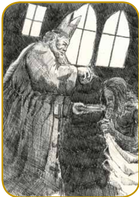
Sveti Adalbert je na Vogrskom oznanjo evangelij že pred letom 1000 - un je po legendi okrsto in férmo svetoga krala Števana (Vajka)

Vojteh se je naraudo kauli leta 955 na Češkom, ime