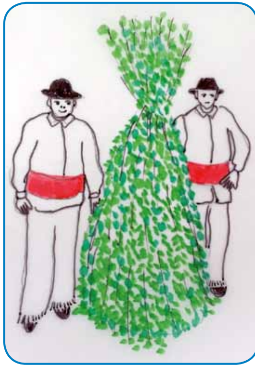
V Bejloj krajini so na djürovo ojldi »jurjevat« trgé podje – ednoga so od glavé do peté naravnali v zelenjé: un je biu Zeleni Jurij

bila, so gi jurjaši zaželejli dosta lagvoga (»aj vam živina zgine pa aj kleti več nede vašoga roda pri tom rami«). Podje so prvo nedelo po djürovim napravili gostüvanje, kama so pozvali svoje pa-