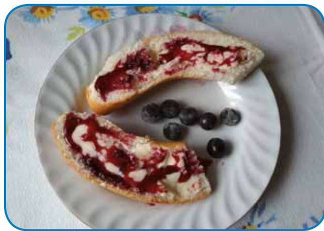
Marmelada iz trnulje trno dobra

Trnina je do 5 metrov viski grm ali menjkšo drejvo, kratki poganjki se nagausta spremenijo v trne. Cvejt-