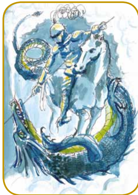
Sveti Djüri, šteri je bujo zmaja, je biu dugo patronuš vitezov, kovačov, konjenikov in vandrašov - gnes brani skavte in policaje

Gnes brodim, ka je Djüri svojo življenje dau za Kristoša kauli leta 303. Tau je bilau v cajti rimskoga ce-