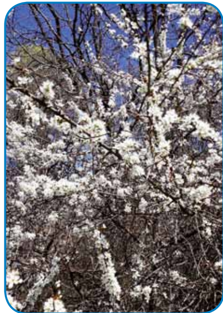
Gda trnina cveté je grm bejli, kak če bi ga snéjg pokrivo

Sprtrolejti, da se po pauti vozimo, že od daleč se vidijo bejli grmi paulek potoka