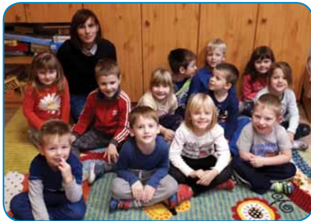
V vrtcu smo vsi dobre volje (Vrtec Gornji Senik)

ustvarjanja, pa tudi telovadbe in gibanja. Opažam, da vse to zelo spodbudno vpliva na njihovo učenje slovenščine in da si otroci tako hitreje in lažje zapomnijo besede in besedne zveze, morda tudi cele stavke. Tudi sicer otroke večkrat spod-