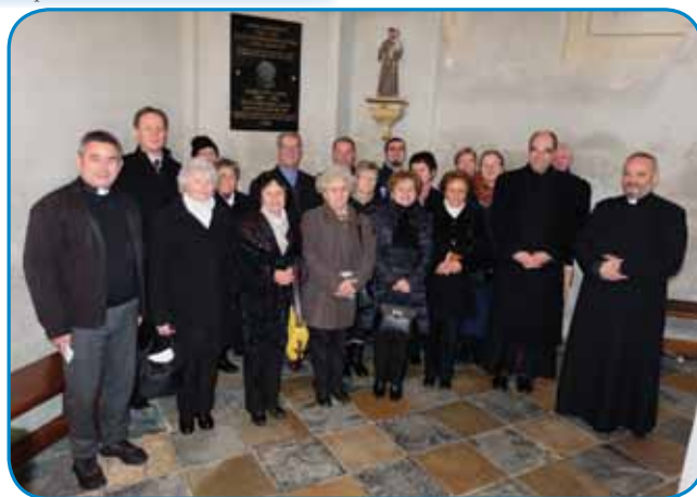
Cerkveni pesmarge iz Števanovec pa Senika s püšpekome pa župniki

je 46 lejt slúžo v Števanovci Baugi pa svojim vernikom. Istina, ka je on nej Slovenec biu, biu je gradiščanski Hrvat, naraudo se je blüzi Kermedina v vesi Felsőberkifalu, dapa med našimi verniki se je navčo slovenski pa je vse do svoje smrti mešüvo, zdavo pa pokapo v našoj domanjoj rejči. Tau rejč je nüco pri veronavuki (katekizmuši) tó, s tejn je dosta pomago pri tom, ka se je domanja slovenska rejč ohranila, ka je gorostala. 1935. leta je prišo v Števanovce, dvej leti je slúžo kak kaplan, potistom pa kak