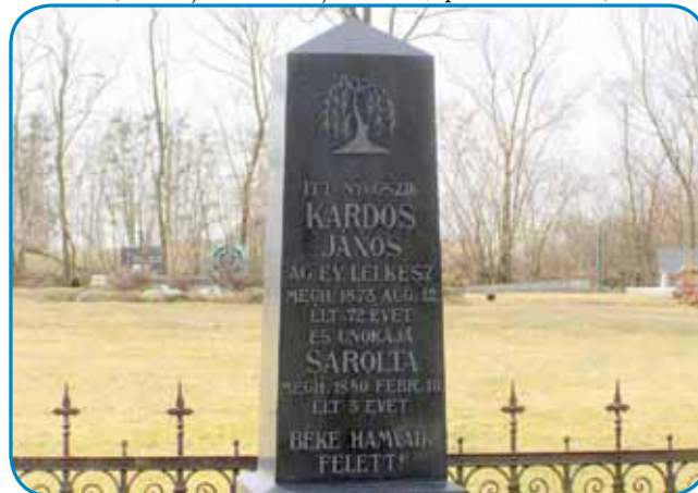
Grob Janoša Kardoša na Hodoši - obračo je vogrske šaulske knige na domanji gezik

je vküppostavo po nemški knjigaj; ino šaulske knige »Té velke ABC ali šolska - Včenjáj«. Te druge knige so cejle dojspisane paralelno vogrski pa slovenski: v ausmi talaj piše o geziki pa pisanji, sledik o dobrom činjenji, o naravi pa zgodovini, o geografiji Vogrske pa županij Vas, Zala ino Somogy, gde so živeli Slovenci. Piso je o zgodovini »Vandalušov«, svojoga naroda, šteri je žlata vsejm Slavom, pa eške o raučni meštrijaj. Na konci knige najdemo pripovejsti z navukom, včenjé računanja