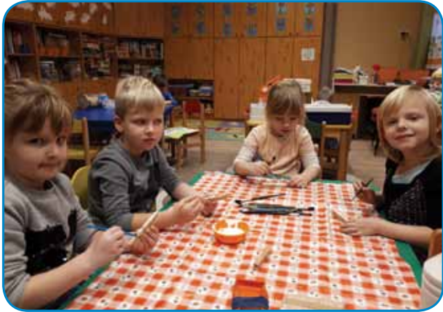
Likovno ustavrjamo (Vrtec Gornji Senik)

Od 1. septembra 2014, ko sem se prvič srečala s porabsko pokrajino in tukaj živečimi ljudmi, pa vse do danes so minila že dobra štiri leta. Na začetku