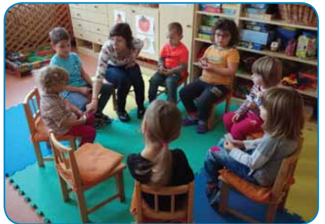
Med malčki v Sakalovcih

Že tretje šolsko leto kot vzgojiteljica asistentka obiskujem porabske vrtce in malčke učim slovenski jezik. Otroci so v predšolski dobi kot »gobe«, ki vsrkavajo nove informacije, zato sem mnenja, da so otroci že zelo zgodaj sposobni in pripravljeni za učenje jezika. Za nami je lepo leto, polno novega znanja in izkušenj. Jezik sem otrokom približala na preprost in zabaven način, skozi igro. Zanje pripravljam raznolike dejavnosti, kot so: gibalne in rajalne igre, deklamacije, prstne igre, izštevanka, pesmice,