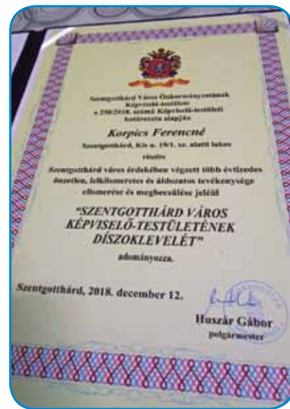
Časna diploma za delo v Trauščaj

»Oni so vsakšoma mala taum, »Sprvoga so mala taum, tau se tak šika, ka obadva gospauda, kaplana tü furt pozove-