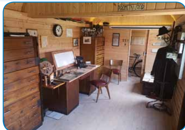
En tau železničarskoga muzeja v vesnici Osluševci

Že v 11. stoletji je bila tü utrdba (eröd), tistoga ipa je cujslišala salzburški nadpüšpekiji. V zgodovini ptujskega grada so bile fontoške tri familije. Prvi so bili gospodi Ptujski, sterim so grad odali salzburški püšpeki. Oni so meli grad kauli 300 lejt, ustanovili so dominikanski pa minoritski klošter pa dali zozidati prauškarsko cerkev na Ptujski Gori. Za njimi je prišla familija Leslie, stera je grad mejla od leta 1656 do leta 1802. Družina Leslie je prišla s Škotskoga, v njenom časi je grad daubo gnešnjo, baročno