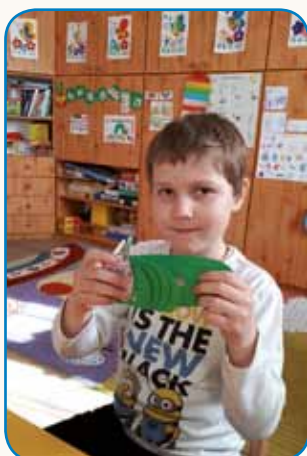
DRAMATIZACIJA PRAVLJICE »ZELO LAČNA GOSENICA« stran 5