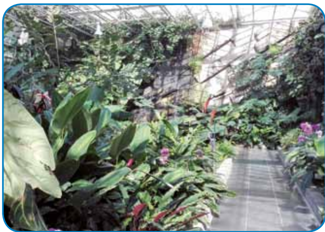
V tropskom gračenki v Dobrovniku več stau féle eksotični rastlik rasté

Donk pa je najlepše, če se po malöj poštiji v lesej napautimo prauti kapejli svetoga Vida. Že ime »Vid« povej, ka má tau svedo mesto opraviti z očami. Nej daleč od male kapejle je vretina, s štere prej najbaukša voda v cejlöj krajini vöteče. Depa tau je nej samo vretina za piti: če