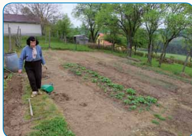
ČE BI NEJ BILAU OGRADCA PA TELEVIZIJE stran 8