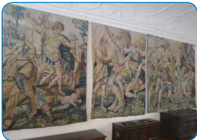
Lejpe tapiserije na stejni grada, stero so zatok gordejvali, ka je v gradi mrzlo bilau

inov, njini potomci (utodók) eške živejo v dosti mejstaj po svejti, dapa kak smo od naše vodnice zvedeli, nej so nazaj prosili tej dragocenosti. Navčili smo se, ka pomeni rejč turkerija. Tau so kejpi s turškimi (törskimi) motivi, največkrat so namalani lidgé, dapa té kejpe so namalali pa farbali evropski molarge. Zbirka turkerij na ptujskom gradi je največša takšna zbirka na svejti. Pri zbirki muzični škeri (majo kauli 300 falatov, od orgel do goslinov, trobent itd.) je ejkstra zanimiva bila dupliška rimska piščal ali tibia, stero so napravili iz čunte nikše živali