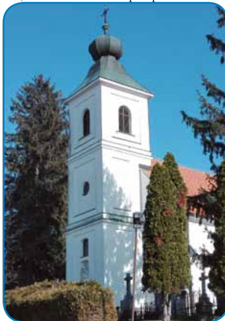
Kapejla svetoga Trojstva stogi na bregej v Lendavski goricaj

Po kratkom blaudenji zvün vesi najdemo graubo veuki šator z malim parkplacom.