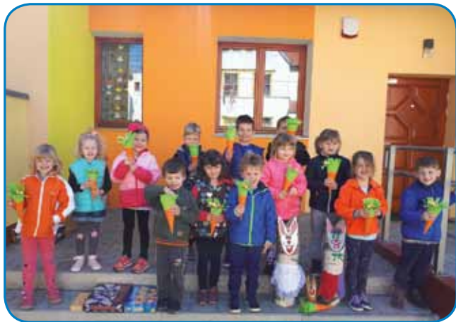
Pred vhodom v naš vrtec nam je velikonočni zajček nastavljal papirnate korenčke, v katerih nas je pričakalo sladko presenečenje

Sreda pred veliko nočjo je bila za otroke v Vrtcu Gornji Senik prav poseben dan, kajti obiskal jih je velikonočni zajčka. Poleg tega pa je otroke čakalo presenečenje, na katerega so že komaj čakali. Veselili so se skrivnega obis-