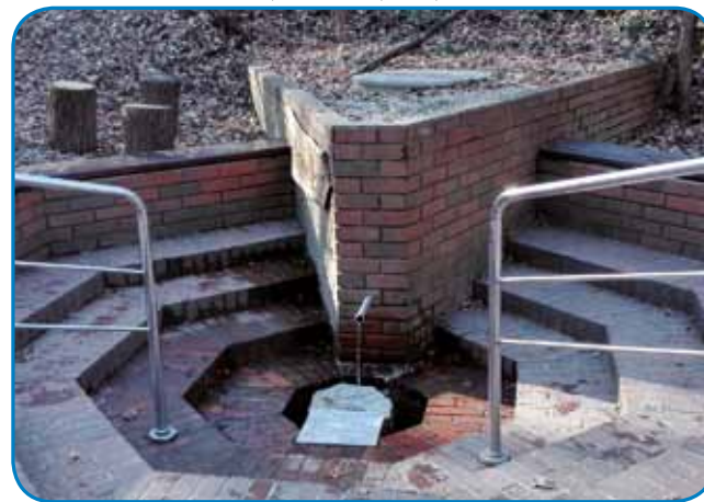
Vretina svetoga Vida pomaga betežnikom na očaj

Drüga paut je malo dukša, pa pripela pautnika doj v Dugo vés. Tam že tabla kaže, v šterom pravci trbej prauti Dobrovniku titi. Dölinska krajina je spoj ravna, poštijja pela skauz male vesi, v šteraj eške gnesden dosta Madžarov živé. Občina Dobrovnik je ranč tak dvojezična, vesnico vogrski Dobronak zovéjo,