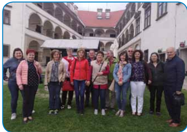
Skupinski kejp na dvorišči Ptujškoga grada

Po prauškarski pauti (na stebre so zapisane skrivnosti vsej raužni vejncov) smo šli nazaj do busa in se odpelali v kraj Osluševci, gde so nas čakali člani Društva za ohranjaje dediščine, Prleški železničar. Oni dosta delajo na tem, ka naj se nej bi zgibilo nika od tistoga, kak se je gnauksvejta delalo na železnici. Zatok so v nekdenšnjem bagauni napravili železničarski muzej, na kraikom filmi pa pokazali njino dejavnost. Slobaud smo vzeli od gostoljubni domanji lidi, steri so nas ponidili z domanjimi pokeraji pa žedni smo tó nej ostali, pa smo se že pelali do slovenske Toscanne, med jeruzalemske gorice. Fanj smo se nasmejali, gda je naša sopotnica rekla, če je mala Toscana tak lejpa, te si mora ogledati