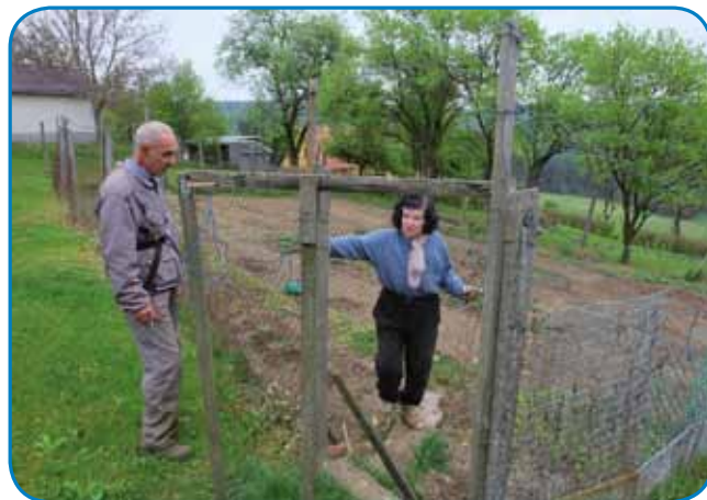
Iluš pravijo, ka je težko delavce dobiti, zatok so veseli, če njim sto pride kositi

bi delala, če bi zdaj taši velki falat mogla pucati. Dobro ka dvajsti, petdvajsti lejt nazaj smo si tak zmislili, ka grūnt