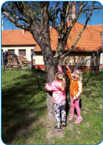
Zajček je skočil na drevo in tukaj skrival čokoladico

ka velikonočnega zajčka, ki jih je razveselil s skrivanjem jajčk v travo. Igralnico v vrtcu smo ob tej priložnosti okrasili