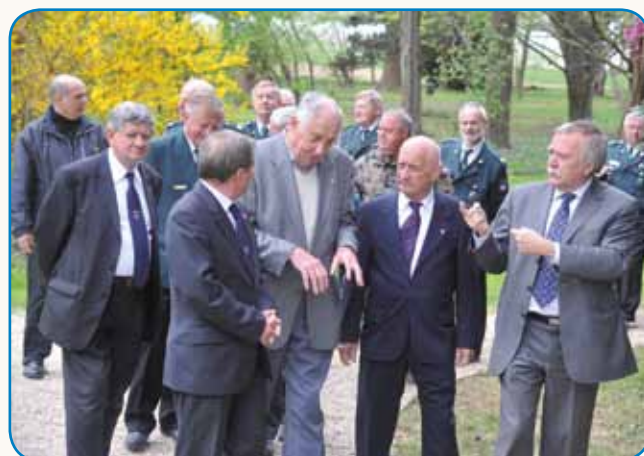
ŠKE ITAK NEMA ČAJTA ZA HOBIJE stran 6