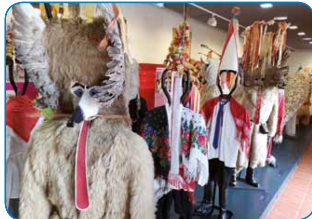
Kurenti si fejst značilni za Ptuj pa okaulico

Pa če smo že bili na Ptui, smo nej smeli mimo fašenka, zato smo si pogledali tradicional-