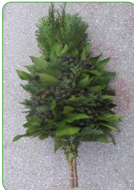
Butara oziroma presmec iz drevesastega bršljana s plodovi iz kleka

uporabne. Nekatere cvetijo že pozno jeseni, pozimi in zgodaj spomladi. Moške rastline s samo prašnimi mačicami so lepše. Pri nas v Prekmurju so s komasacijami skoraj izginile. Slišala sem, da naši cvetličarji uvažajo tudi mačice iz Nizozemske in jih prodajajo po dokaj visoki ceni. Mačice se sicer množijo z lesnatimi potaknjenci ali z grebenicami. V