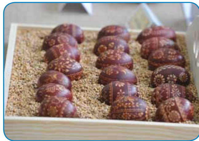
Z lükovimi lopinjami pofarbana djajca