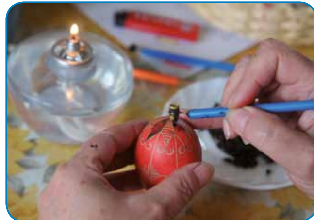
Tak se pišejo djajca