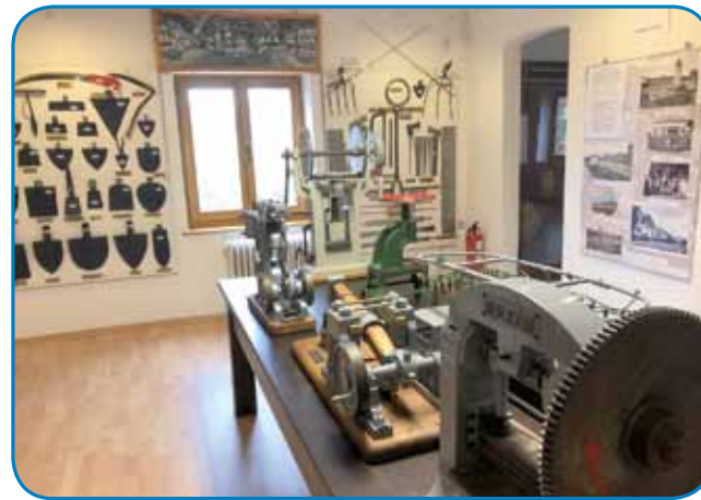
Na stenej kose, motke pa žage - na stoli modeli mašinski klapačov

material vküppobrati, smo čüli od direktorice. »V arhivaj smo najšli kejpe o gasilskom družstvi pa šaulski mlajšaj. Gor smo ponücali stare razglednice tö.«