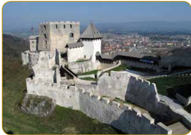
Najveksi središnjeveški grad kraljije nad »knežim varašom« Celjom

do konca prve svetovne bojne kraljvala slovenskim deželam, od srejde 15. stoletja dale pa so - z ništernimi pavzami - prejkmeli Vogrsko kraljestvo tō, z našimi vogrskimi Slovencami vküper.