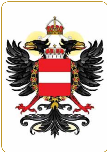
Dvoglavi orel (kétfejű sas) Habsburžanov je do konca prve svetovne bojne nad glavauv Slovincov lejto

dobila veuko mauč. Grünte so prejkvzeli na Štajerskom, Koroškom ino Kranjskom, od druge rodbine, od Vovberški pa so erbali varaš Celje. Leta 1341 so je