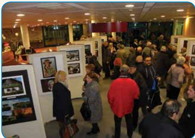
Večni popotnik... stran 4