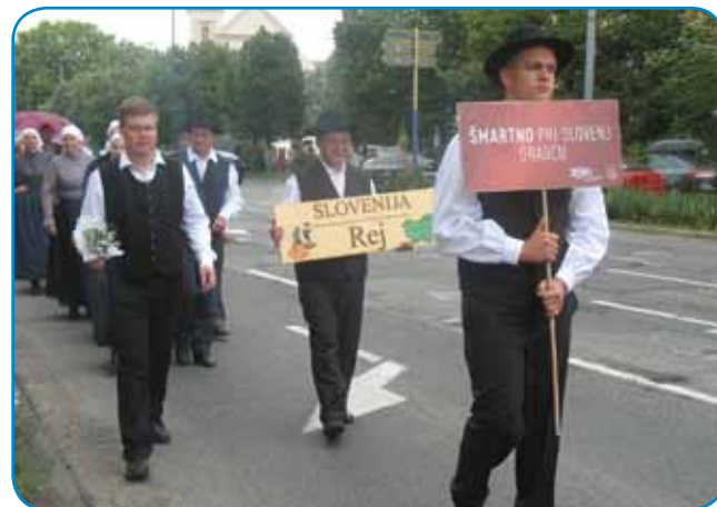
Koroški Slovenci v svoji gvantaj na Martinovom festivali (ozajek Martinova cerkev)

lepotam na püšpekovej cerkvi, gde so nutpokazali zgodovino varaša Somboteu od najstarejši časov do gnes. Par mejsecov kisnej pa so s svejklöstjov pofarbali cerkev svetoga Martina tö, na šteroj smo leko spoznali pripovejst o žitki sombotelskoga svetnika v kejpaj pa rečaj.