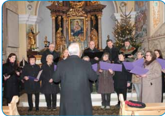
Letos so koncert gostili v župniji Dolenci. Kot prvi so se s pesmima Prišla je noč in Pastirci kam hitite predstavili domačini.