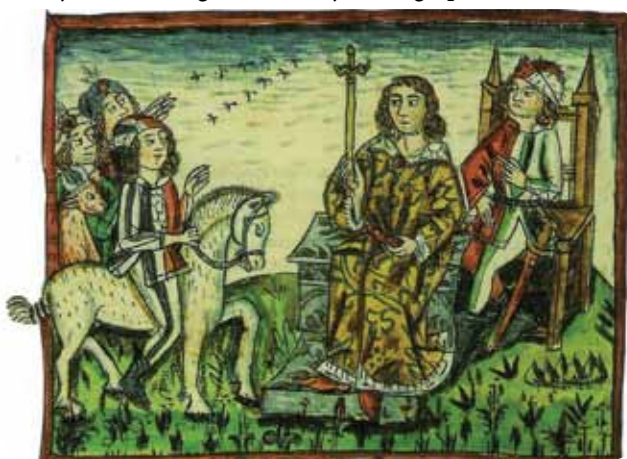
Koroškoga vojvoda so do 1414 na mesto postavljali po karantanskoi slavskoj ceremoniji

Ta ceremonija se je gordržala do leta 1414. Kneži kamen je gnes v Celovci (Klagenfurt) v dvorani deželnoga zbora, najdemo ga pa na slovenski 2