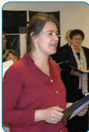
Štajerski Slovenci v Avstriji stran 6