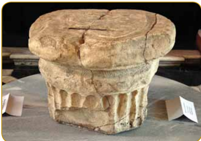
Kneži kamen je spaudnji tau rimskoga sojá, simbol moči staroga slavskoga rosaga Karantanije

Što smo Slovenci? Od kec smo prišli? Zakoj djenau na tau zemlau? - tau so pitanja, štera so dugo-dugo kroužila v glavej slovenski čednjakov indašnji cajtov. Istina je, ka o slovenskom narodi žmetno gučimo pred 19. stoletjom, eške ime »Slovenci« je protestantski predgar Primož Trubar samo pred malo več kak štirimi stoletji na paper dojspiso. Če rejsan ništerni pravijo, ka smo na svojoj zemlej od vöka vökov, vekši tau zgodovinarov je gvüšen, ka so stari starci našoga naroda v gnešnje krajino prišli v drugom tali 6. stoletja.