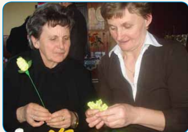
Če bi leko... stran 8