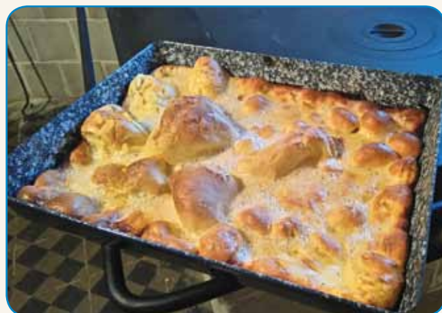
»Gastroangel« v Andovci stran 7