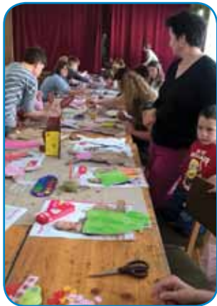
Delavnice so se udeležili otroci in tudi starši

Slovenska narodnostna samouprava na Dolnjem Seniku je 31. marca organizirala velikonočno delavnico. Delavnice v