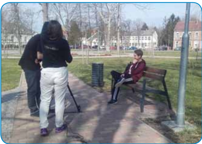
Med snemanjem v Monoštru