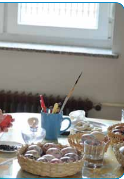
a djajca v tehniku batik

pa te ške črno farbo cuj dam in je te gotovo. Můva z očom sva te djajce ške k svejči cuj