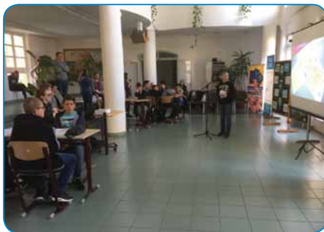
Člani ekipe so morali na kvizu na kratko predstaviti Slovenijo

»Kviz se imenuje 'Ljubim te, Slovenija'. Na to temo so morale ekipe pripraviti krajšo predstavitev« - je povedala učiteljica