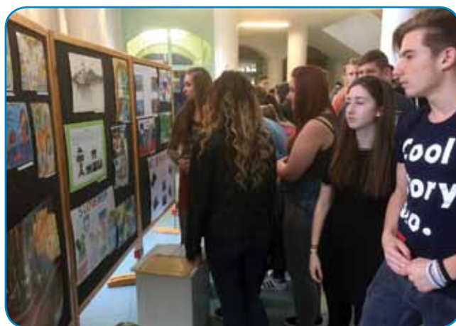
»Naša sosedba Slovenija« - razstava tokrat spet v Monoštru

Vodstvo Gimnazije Mihály Vörösmartyja si želi, da bi prireditev postala tradicionalna in tako pritegnila čim več mladih k spoznavanju Slovenije, Slovencev in njihovega jezika.