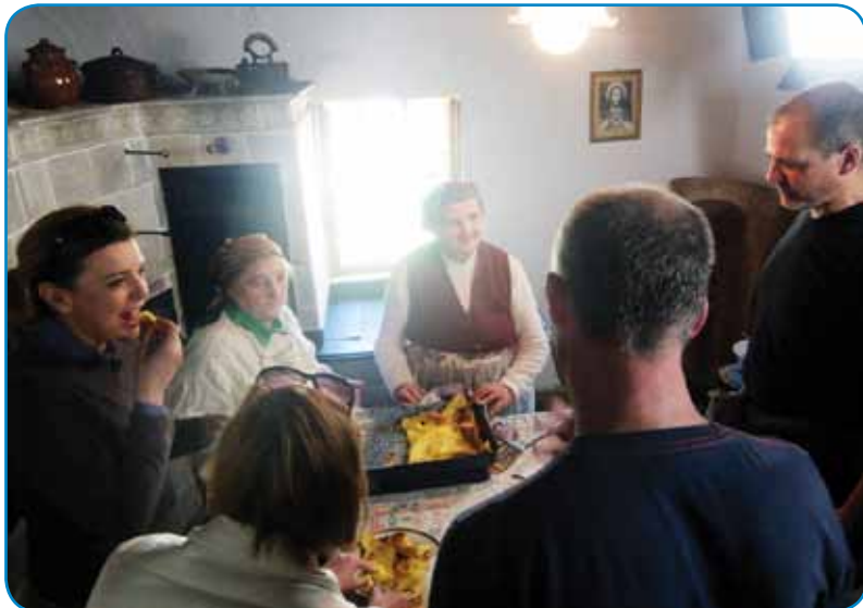
Ekipa (stáb) v künji andovske stare domačije

go fejest briga, dosta spitava, gda se kaj küja, dapa tau moramo znati, ka je ona sama tó fejest dobra küjarca. Istina, ka nej vönävčena sakačica, dapa razmej se k taumi, nej zaman je že več knjig (kuharic) vödala.