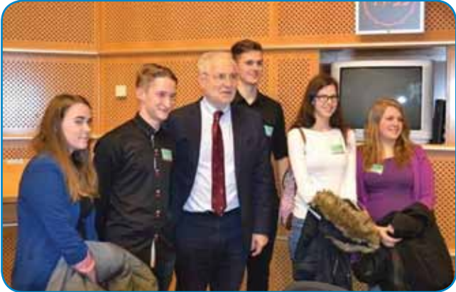
Monoštrski dijaki s slovenskim poslancem Ivom Vajglom v Evropskem parlamentu