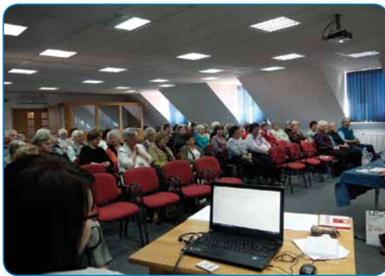
Na občni zbor je prišlo 71 členov društva, tau je več kak 73 procentov

samo tak leko zadobimo, če se med seov v domanjom dzejiki pogučavamo, ranč tak z drüdjimi slovenskimi znanici, najbola pa doma v svojoj držini, če se mammo s kin slovenski pogučavati. Dosta nam pomagajo slovenske knidje, novine, slovenski guč, zatau vas ta-