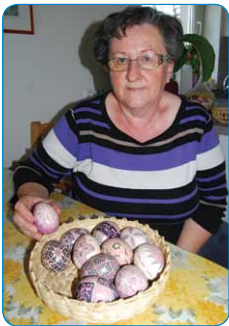
Zadnje cajte dela tudi remenke lilaste farbe

dejvala, ka se je vosek raztaupo, zdaj pa ges djajce denem v rejdlin, na 100 stopinj Cel-