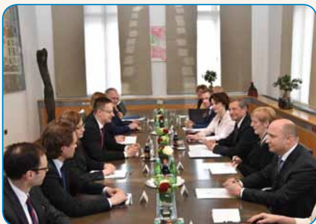
Madžarski zunanji minister v Sloveniji stran 3

VSEM NAŠIM BRALCOM ŽELEJMO BLAJŽENE VÜZENKE SVETKE!