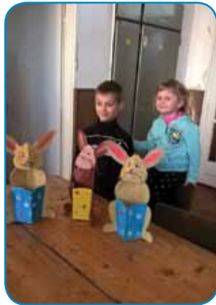
Zajčki s košarico

Vzorec zajca smo izrezali iz kartona in ga potem pobarvali. Dolga ušesa, dolge brke, nos, očesi, tačke, rep... in je bil zajček narejen. Naredili smo še košarico, ki jo je držal med