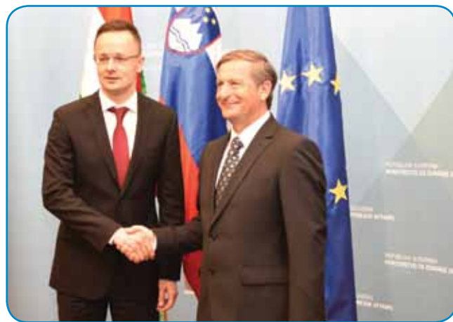
Zunanja ministra Madžarske in Slovenije Péter Szijjártó in Karl Erjavec

Višegrajske skupine, še posebej v času madžarskega predsedovanja V4.