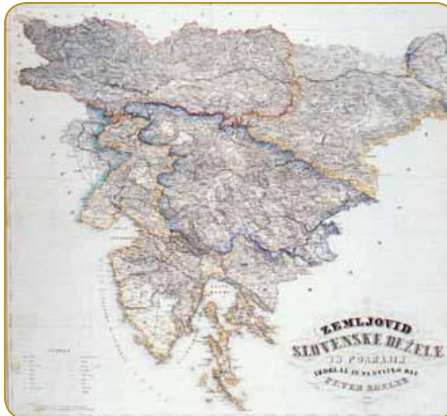
»Zemljevid slovenske dežele« Petra Kozlera je oprvin s črnov linijov pokazo, gde vse Slovenci živemo

slovensko narodno gibanje leta 1848 stau pilo iz kulture v politiko, so Novice velko delo napravile. Pisci iz več dežel so začnili nücati rejči »Slovenec« ino »slovenski gezik«. Ime »Slovenija« je v Novicaj oprvin dojpsio pesnik Jovan Vesel Koseski , od ti-