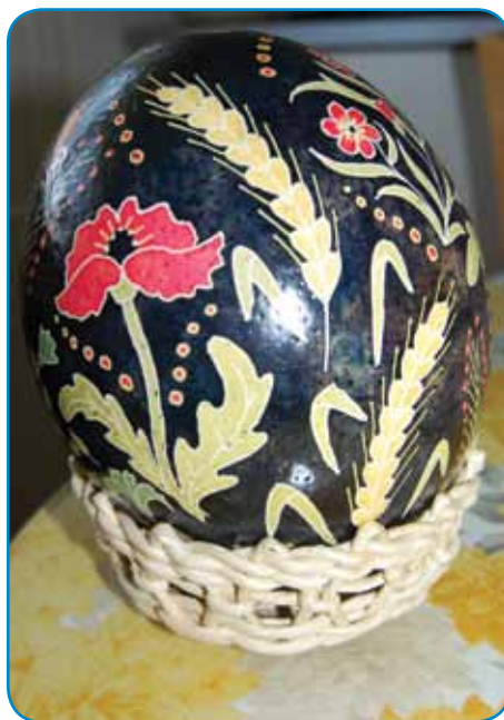
Za nojovo (strucc) dajce ponūca deset vōr

»Gda sam mala bila, sva z očom pred vūzenkom furt farbala dajca. Tau so nej bili kakši preveč komplicerani motivi, bole rauže, mačice in