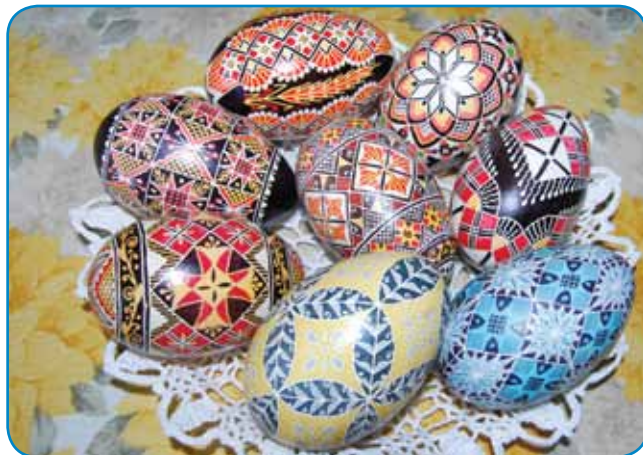
Farbe pa minte so leko trno raznolike

v enom kedni, vej pa ne more telko cajta vkūp delati, sploj ka oči tō trno trpijo. Za kokošeče pa ponūca okauli pau vōre, odvisno od minte. Prva je s svejčo delala, zdaj pa zavolo oči ma električni posvejti tō. Po tistom, gda dajce vōsfuda - prva je tau z lampami delala, zdaj pa ma eno takšo pumpico – ga ške dobro zasperé. Gda lūknjico z voskom (viasz) zadela, vzeme v roké