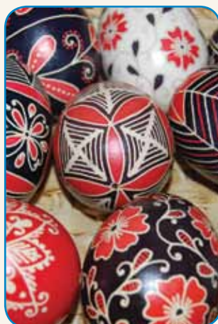
Gda mene tau prime,... stran 2-3