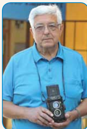
Kejpe trbej na paperi tō vönpraviti stran 4