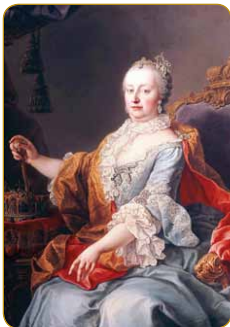
Marija Terezija je bila kralica Vogrske ranč tak, mejla je 16 mlajšov

spisali sodačko slüženje (zvün za dühovnike, plemiče ino bautoše). Pavri ino varašanci so mujs mogli rukivati, nut so je leko pozvali do smrti ali do invalidnosti. S temi reformami pa se je situacija prausni lidi pobaukušala: rosag je je nüco kak plačevalce porcov ino sodake, zatok je je branila pred