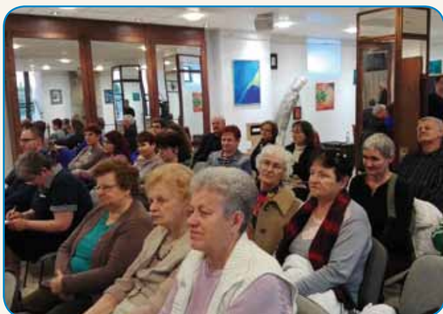
Ob-mejne življenjske slike stran 3