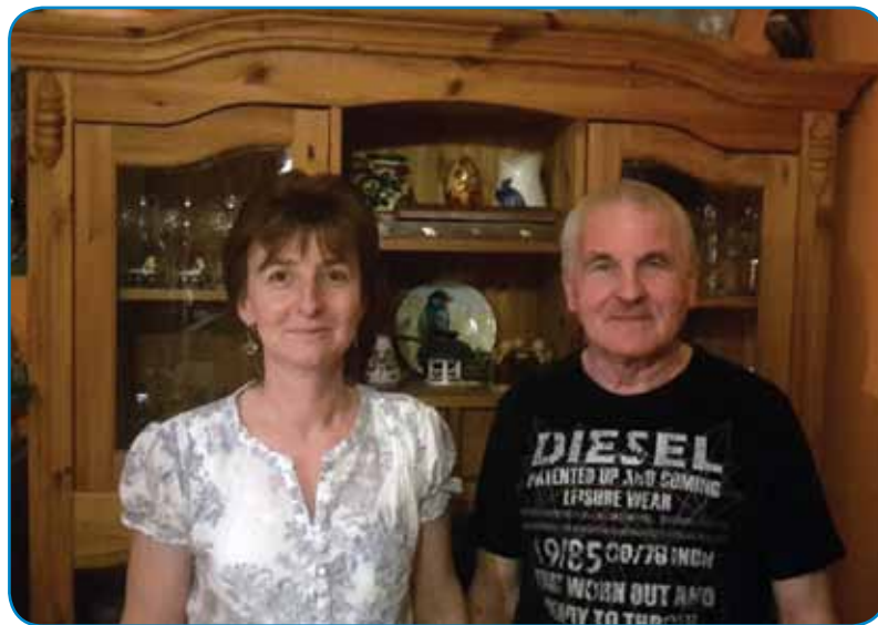
Z možaum, steri je dosta na pauti, ka tovarnjak vozi

lo odli. V sploj lejpom mesti smo mi doma bili, samo tam je življenje bola težko bilau, kak tistim, steri so skrak doma pri poštiji. Mi smo sausedov nej meli, samo Djörtjino Ano, dapa ona se je tö v nauvi ram spakivala na Bedi brejg. Dapa vseedno ka je težko bilau tam življenje, mena se je bola vidlo na vesi kak tü v Varaši.«