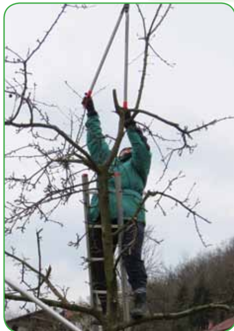
Čas je za obrezovanje starih sadnih dreves

sko in kulturno dediščino naših vrlih prednikov.