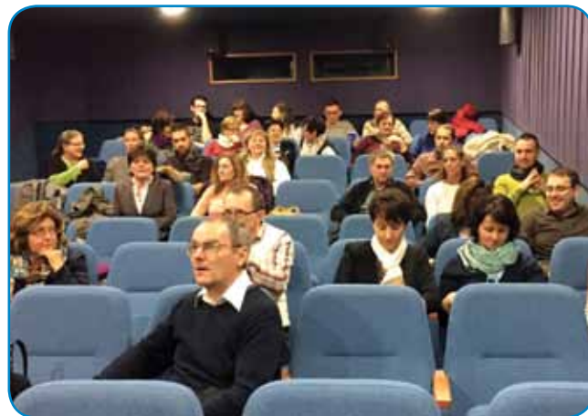
Prvi slovenski filmski večer v Sombotelu je bil lepo obiskan

ris Jesih, je na kratko predstavil svoje razmišljanje o dvojezičnosti. Kakor je poudaril, je le dosežek zadnjih nekaj desetletij, da večina mladih govori več jezikov. Dvojezičnost pa je nekaj drugega: govoriti dva jezika od rane mladosti in odraščati v dveh kulturah.