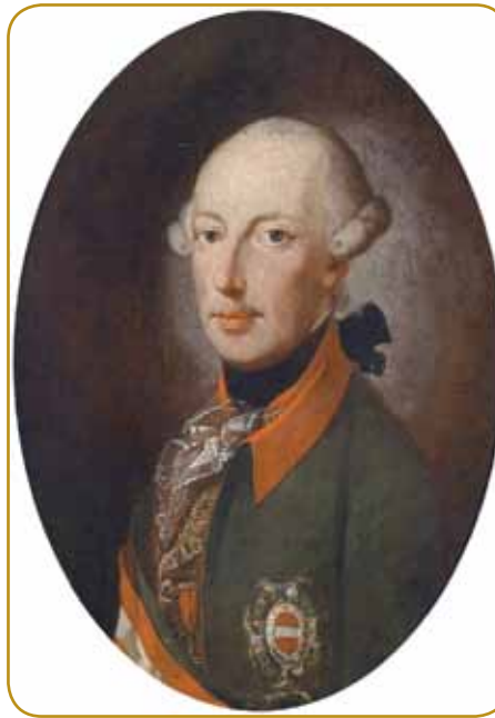
Za Jožefa II. ino njegvo mater pravimo, ka sta bila »razsvetljeniva absolutista«

drügimi o nücanji fčelarski košov.) Vesnice na Slovenskom so spoj ovaške gratale, pavrom je mesto 30 procentov penez ostalo 70 procentov (od šteroga so plačüvali za cerkev, šaule ino upravo). Lüstvo po vesnicaj je začnilo delati v bole intenzivnom ritmuši, več dni v leti. Pred reformami so zvün po nedelaj počivali eške na več ducatov svetkov, v ništerni krajinaj so meli več kak 120 slobaudni dni. Tau se je v drügoj polovici 18. stoletja pomenjšalo na 70. Če je paver več delo, je več zaslüžo ino več porcov plačüvo - so gorprišli voditeli rosaga. Ali kak je Marija Terezija pravla: » Birko trbej raniti, če go škemo briti pa dogiti «.