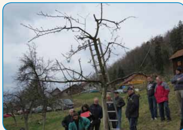
Travniški sadovnjaki so vir zdrave energije stran 6