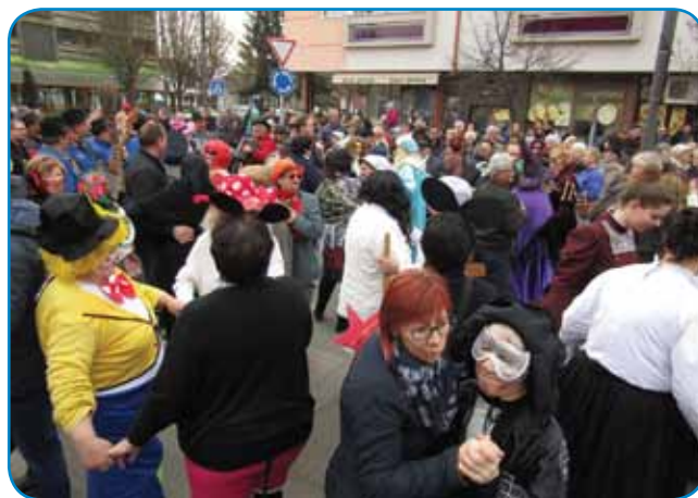
Plesalo je staro ino mlado

sapo nöjco, bi se buma zasapo. Té pa nej čüda, če so samo té vpa-met vzéli, ka Fašenka z Lenkov nin nejga pri kejpianji, gda so se napautiti steli. Fašenek pa Lenka sta glavniva, nejga ka. Njiva sta vodila povorko, za njimi so včasik gorički padaši maširali, potistim vsi nota naravnjeni penzionisti, steri so se med potjauv veselo trausili, na raji skakali, ka njij tašoga ipa prej nikdar nika ne boli. Na srejdji so bili Vinski bratje, steri so davali muziko pod peté sakalauvskej mladój folklori pa vsejm Sakalauvčarom, steri so redno pomladili s svojimi modernimi maskami té dugi red. Za njimi so pa vlekli muzikanti Nimam časa iz Rogošovec, aj lüstvo, stero ji sprvaja, tü leko pozna tau