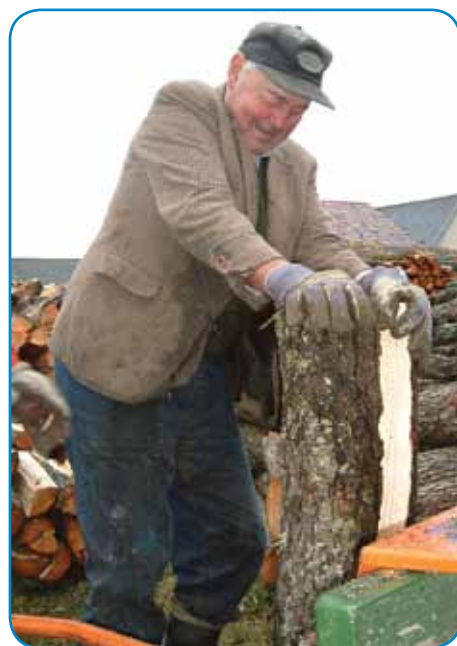
Pufarin Vendel rad dela z drvami

delo, pa tau je bejla moja velka sreča, zato ka te čas, gda sem nej bejo doma, so moje stariše, brate pa sestere taodpelali na Hortobágy. Plača je nej vej ga baug bejla, dapa tejtstoga reda je dela tö nej bilau, ka bi leko prebire, z Andovec so