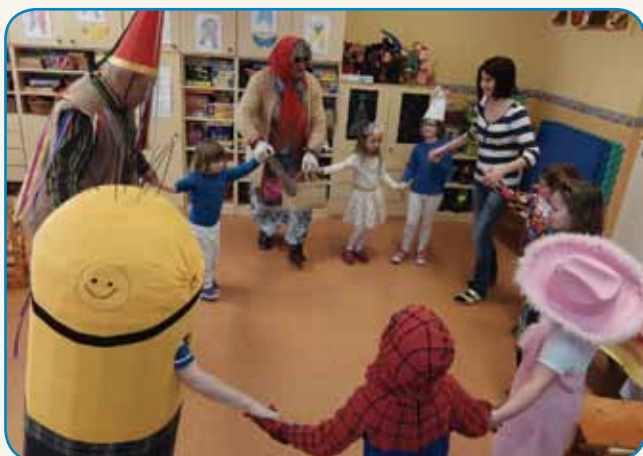
Duga repa, kusti len... stran 2