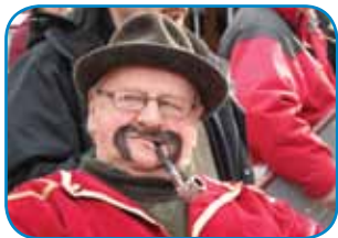
Döbrögi s pipov

Drüštvo porabski slovenski penzionistov pri svojem deli ma dostafela doužnosti za svoj narod, za slovenstvo. Med tejmi je, ka pomaga gora držati, obraniti in-