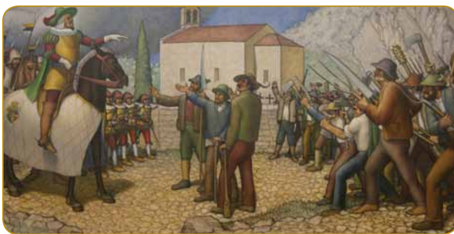
Zaman je bilau pavrov dosta več, gospaudge so je vsikdar dojzbiti (Tolmince na kejp Toneta Kralja ranč tak)

depa so se nej pogučavali z odposlanci dežele. Raj so uni sami poslali svoje lidi k casari. Doma so prejkvzeli več gradov, rabuka se je - zvŭn našoga Prekmurja ino dežele Goriške - vužgala na cejlo Slovenskom. Gospaudge so vseposedik zbej-