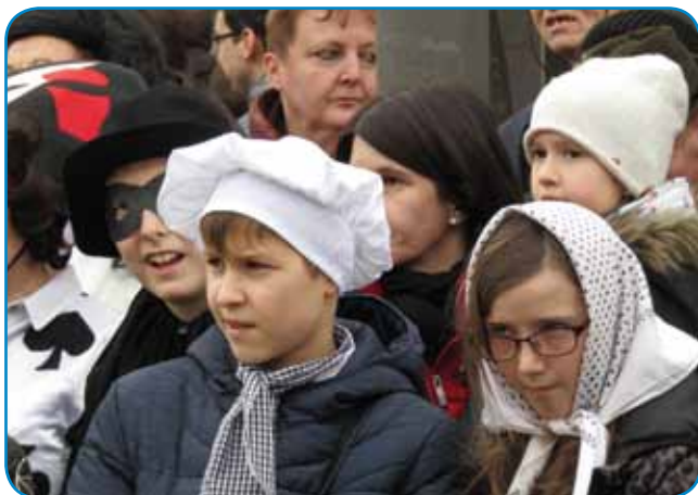
Mlajši iz Sakalauvec

dašnje porabske šege za mlajšo generacijo. Slovenski penzionisti so si že včasik po ustanovitvi drüštva fašenek vöodebrali. Zatok so se pa že včasik 1997. leta na fašensko nedelo bole batrivni penzionisti nota naravnali pa norüvali, s tejm razveselili svoje vrstnike v Slovenskom daumi. Penzionisti so prejk dvajsti lejt velki stopaj naprajli s tejm, ka so od leta do leta furt na vekšo šli,