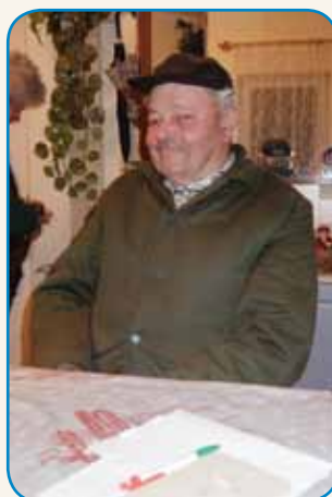
Če zdravdje slüži... stran 8