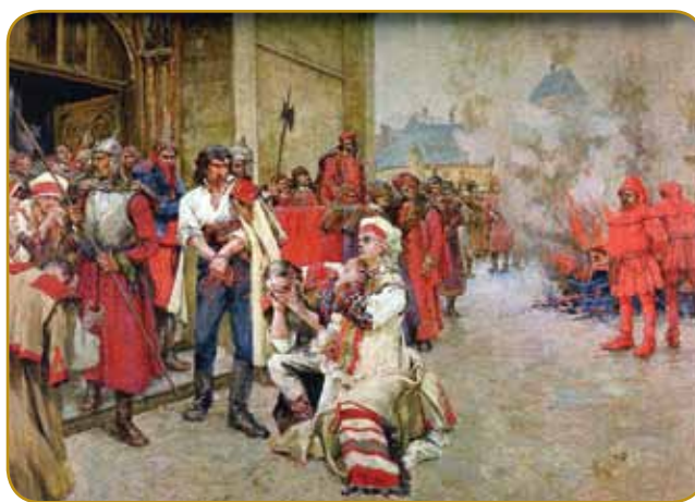
V Zagrebi se pripravljajo na mantranje paverskoga prejdnja Matije Gubeca (kejp Otona Ivekovića)

Ejkstra središča so se začnili povezŭvati na začetki leta 1515. Pavri so napravili svojo »zvezo«,