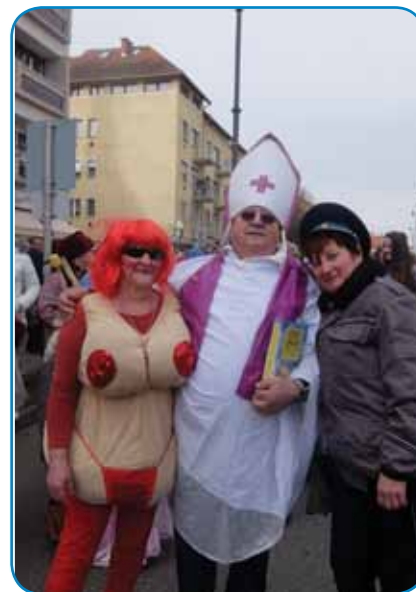
Pisana družčina, Porabki z Goričancom

ugi, tau znamenüje, ka so civilni lidge želeli biti med njimi. V povorki je maširalo malo prejk 130 lidij, steri so bili gora naravnjeni, té muzikanti pa sakalauvski folkloristi, stera so sprvajali penzionisti, ki so samo gledat prišli pa dosta drügoga lüstva se je vküp nabralo med potjauv. Zvöjn in-dašnji maškar, stera mujs morajo biti, je dosta moderni, danešnjoga časa vözmišleni dobri maškar bilau. Človek bi ranč nej brodo, ka so penzionisti, tak domanji kak iz Slovenije tü, tak kreativni, tašo vse kaj si vözbrodijo. Mladi Sakalauvčarge so pa zvekšoga