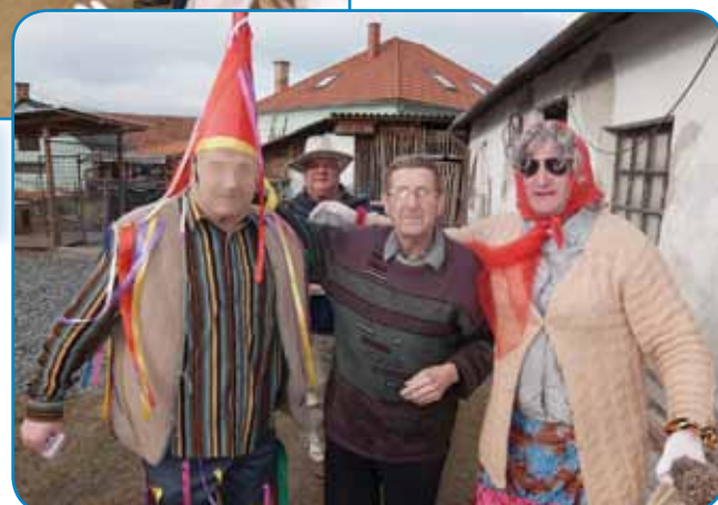
V Sakalauvca nas vsakšo leto čaka Ledinani Feri (Bene)

vöposenila. Odtec smo v sakalovski vrtec šli, gde so nas mlajši že fejst čakali, pa ranč tak saused,