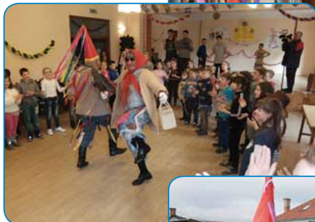
Na Gorenjom Seniki so nas šaularge počakali v kulturnom daumi

Zato, aj se ne pozabi, aj mlajša generacija vidi pa tadale nese tau staro šego.