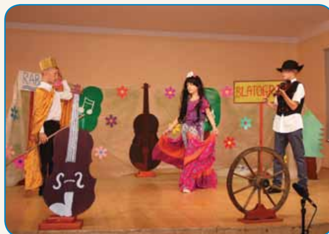
Že od malega je treba stati na odru... stran 10