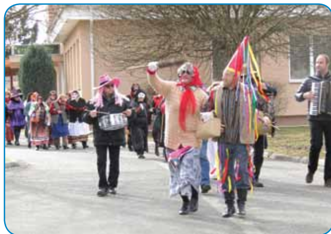
Povorka se napauti od Slovenskoga doma

radostjov vzela pozvanje. Etak so penzionisti vküper s samoupravo vesi Sakalauvci pa s slovensko